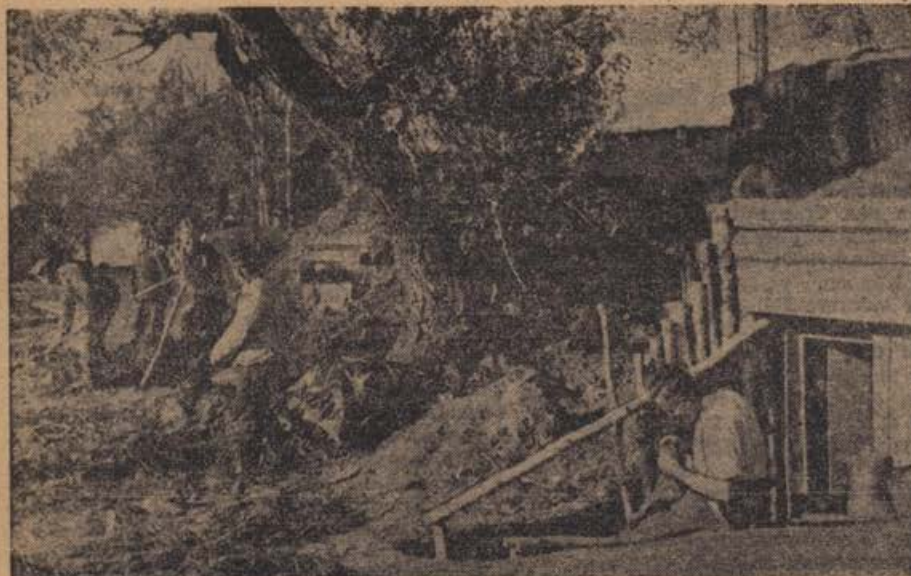
PK.-Aufnahme: Kriegsbericht Maltry (Wb.).