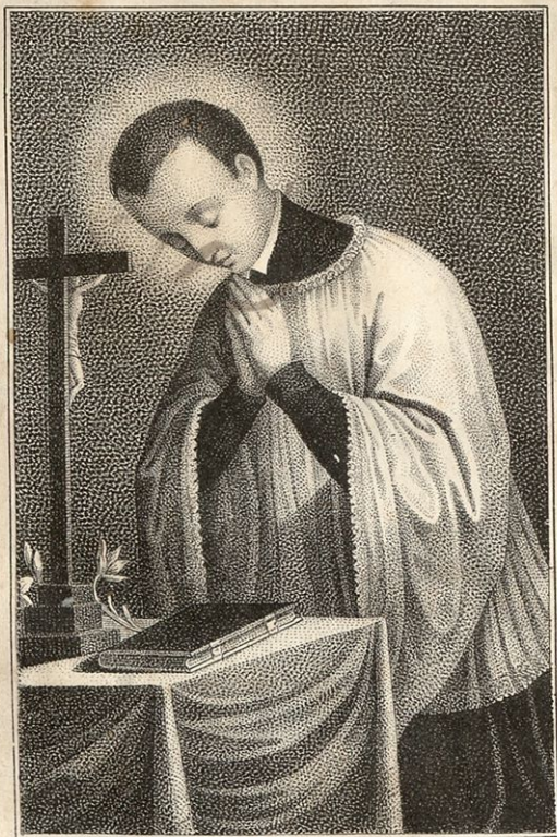
S. Aloysius de Gonzaga.

Lith. u. Kunsth. v. Gebr. Cu. v. Benziger in Einsiedeln.