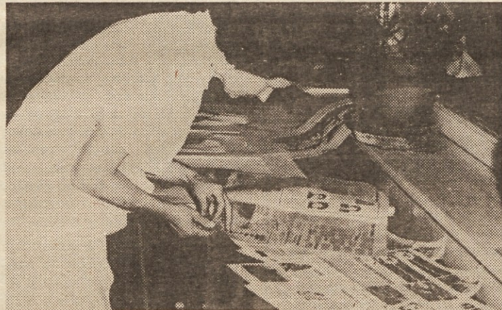
V času tradicionalnih luških dni je bila v Osnovni šoli Gradišče odprta razstava dokumentov in fotografij, prikazovali pa so tudi filme o razvoju koprke luke. Kolektiv Luke ima namreč patronat nad to šolo in v času razstave so se srečale tudi delegacije kolektiva Luke Koper, osnovne šole in krajevne skupnosti Gradišče. Pogovarjali so se o uspešnem nadaljnjem sodelovanju.