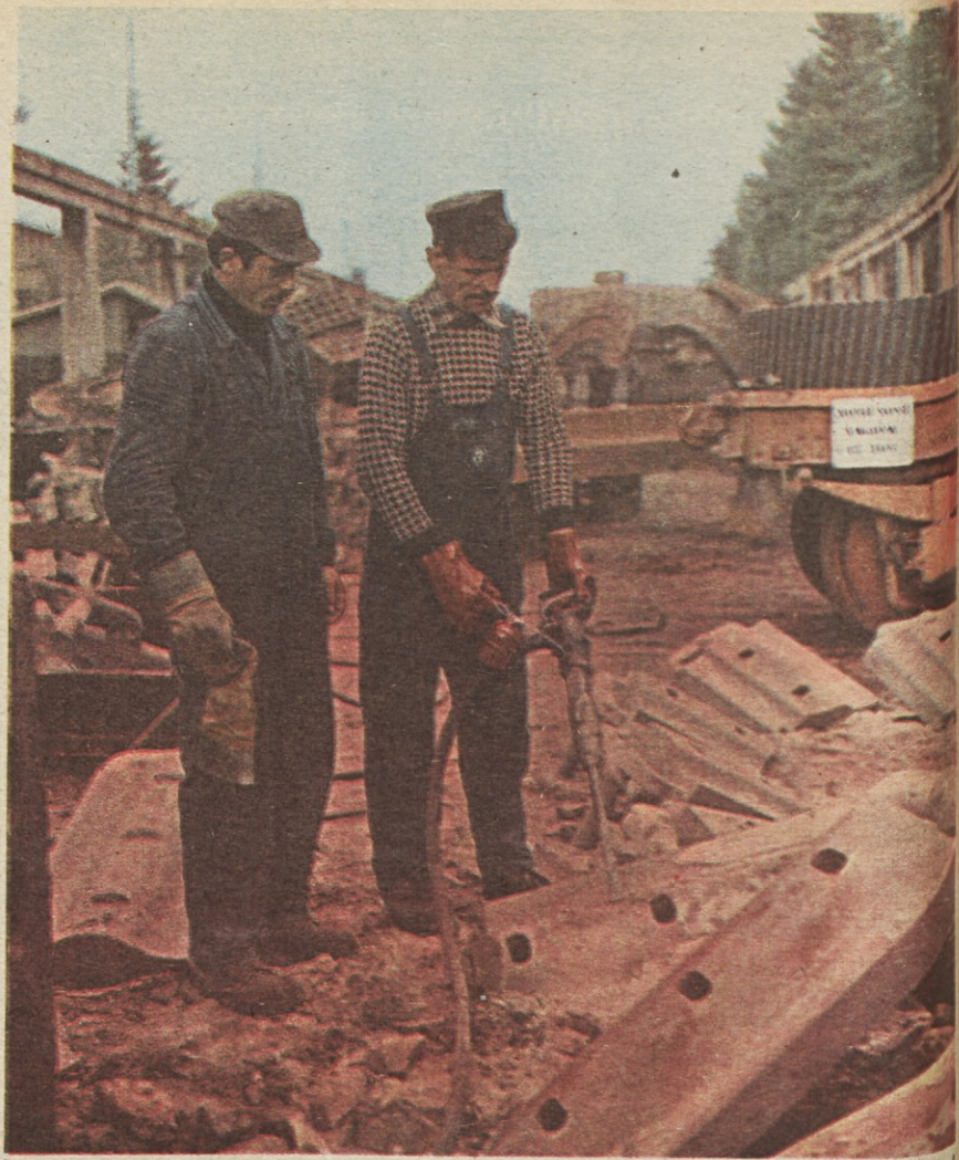
Jožetovo delo ni samo v skladišču, na skrbi ima tudi vse vrtnalne in brusilne stroje v svojem oddelku