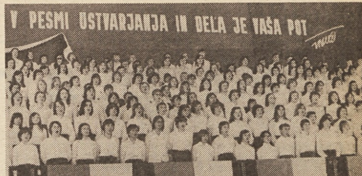
Celje kot vsakoletni gostitelj Festivala mladinskih pevskih zborov je lahko ponosno na to manifestacijo, na kateri se vsako leto zbere nekaj tisoč mladih pevcev, najboljših predstavnikov mladinskega zborovskega petja v Sloveniji, Jugoslaviji in v tujih deželah, ki se udeležijo tudi mednarodne glasbene manifestacije.