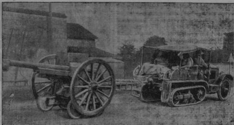
Motorizirani poljski topovi na Francoskem.

Naročniki »Sloven kega gospodarja« plačajo samo polovico!