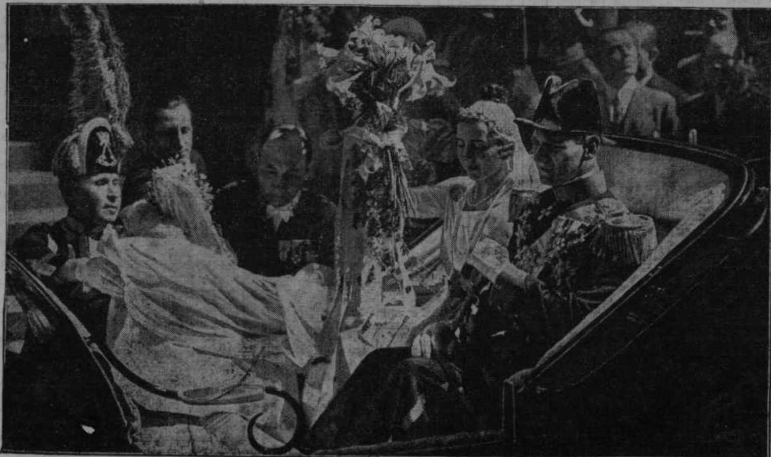
Danski prestolonaslednik se pelje po poroki po okrašenih ulicah Stockholma, kjer ga pozdravljajo Danci in Švedi.