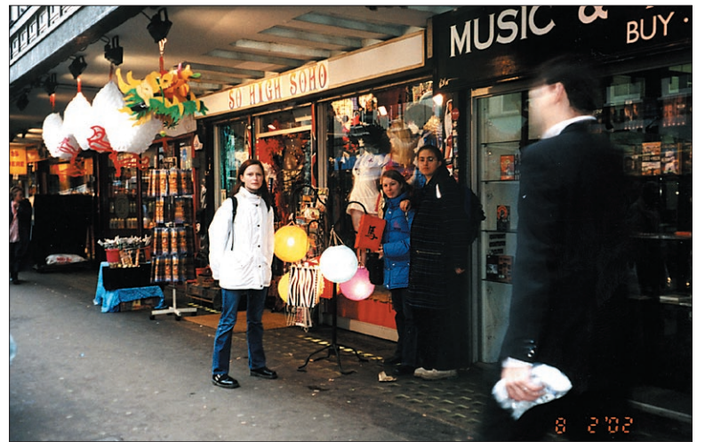
V razuzdanem Sohu

Pol nekaj urah spanja, ki bi jih bilo mogoče prešteti na prste ene roke, je napočil čas, da se seznanimo z londonsko akademsko srenjo na University College of London, oziroma da vsaj odposlušamo predavanje o Platonovem Simpoziju na oddelku za angleško književnost v prej omenjeni inštituciji. Blagor angleškemu študentu, ki jim je predavateljica napisala celotno vsebino predavanja, pa še kaj več, na izročke. Blagor angleškemu študentu, ki lahko dinamično diskutirajo med seminarji v majhnih skupinah, medtem ko mi anglisti na Filozofski fakulteti v Ljubljani preživimo večino naših dni v premajhnih in zatohlih učilnicah, kjer fanatično zapisujemo besede naših profesorjev. Blagor angleškemu študentu, ki imajo v primerjavi z nami zanimivo malo šolskih ur na teden, da se lahko v miru posvetijo kreativni pripravi na seminarje. Amen.