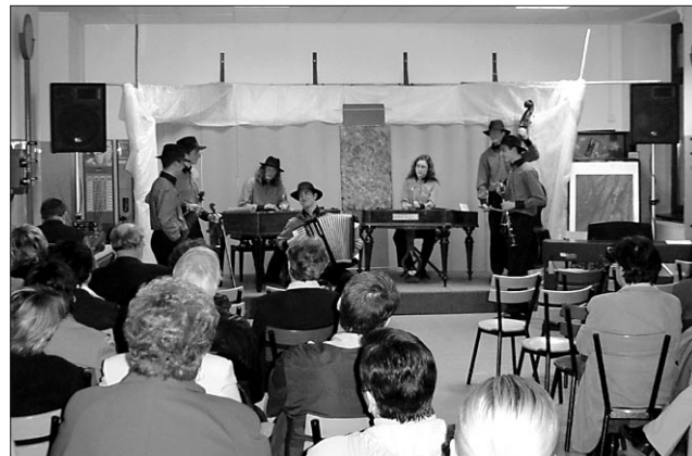
Na Večeru dijaške poezije se je predstavila tudi Mlada beltinska banda.