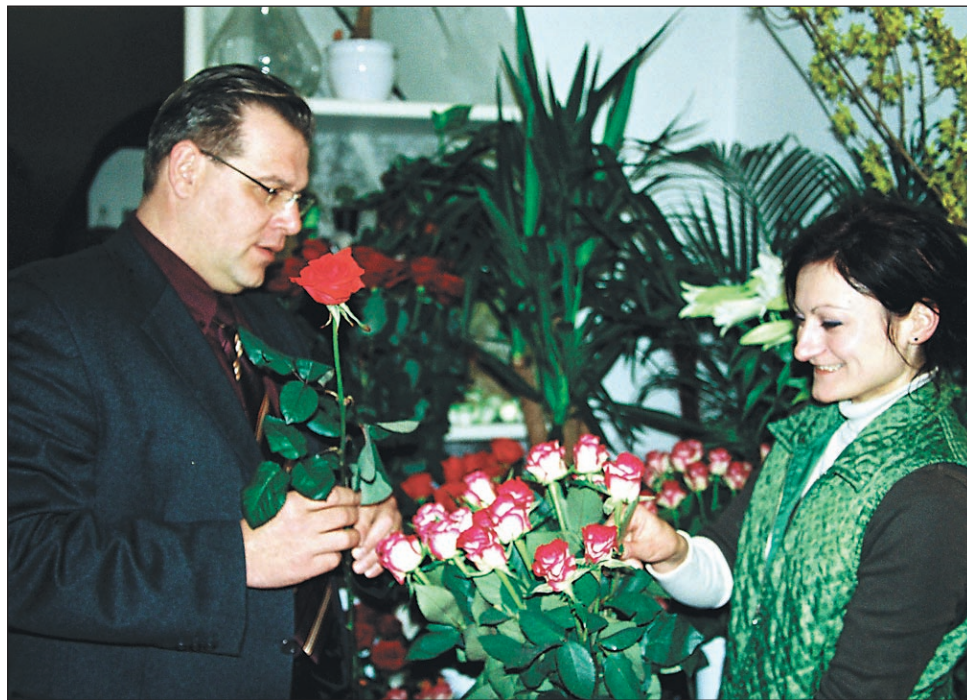
Naj cvet ob materinskem dnevu pove, česar ne zmorejo besede.