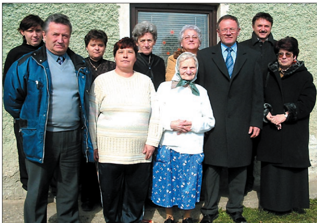
Ob visokem jubileju so Mimiki poleg domačih čestitali tudi predstavniki videmskega društva upokojencev, župan, podpredsednik KS Videm in predstavniki Karitas.

To je Mimika dokazovala vse svoje življenje. Rojena Videmčanka je po končani osnovni šoli - šolske klopi je gulila danega leta 1920 - znala uveljaviti svojo voljo. Še najbolj je to dokazala ob nakupu zemlje po vojni, leta 1945, v središču Šturmovca: "Mož ni bil najbolj navdušen nad izbiro, saj je bila vsa parcela zarasla z gostim grmovjem, ki ga je bilo treba pred gradnjo hiše najprej očistiti. O, vam povem, da ni bilo lahko! Sem morala včasih biti kar huda, da je bilo delo opravljeno, kot je treba," se spominja drobna Mimika.