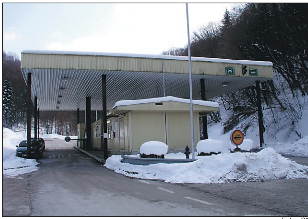
Mejni prehod v Zg. Leskovcu.

niti pogovora o tej pereči problematiki, kaj šele, da bi lahko uveljavili svoje zahteve. Naša občina ima približno 13 kilometrov Schengenske meje, mednarodni mejni prehod imata tako občina Podlehnik kot Gorisnica, pri nas, kjer je postavljena ustrezna infrastruktura in dokazana velika frekventnost prehodov, pa bi naj ostali brez njega?! Jasno je, da se s tem ne bomo strinjali in kot so sklenili svetniki, bomo v skrajnem primeru pač posegli po takšnih