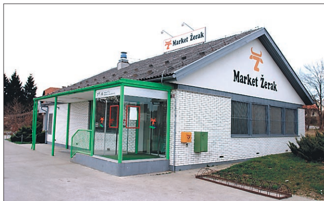
Market Žerak je dobil novega lastnika.