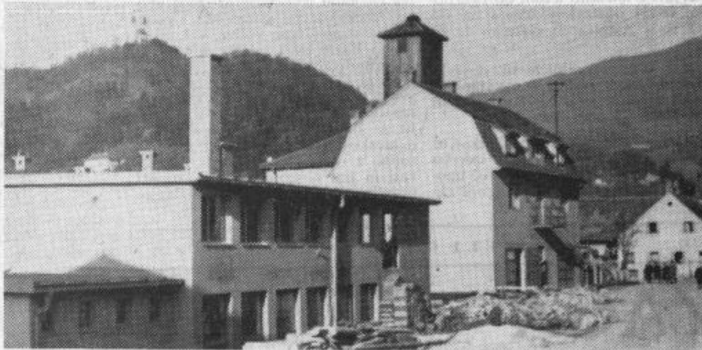
S Topoletovo »bognarijo« je Laško izgubilo zadnji atribut podeželskega mesteca

Posvet je imel vsaj to vlogo, da je opozoril širšo javnost, da turizem nikakor ni in ne more biti domena turistično atraktivne Gorenjske, temveč je že doma v Savinjski dolini in bi ob pravilnem posluhu ter pomoči lahko postal pomemben vir dohodkov prebivalcev Zgornje Savinjske doline.