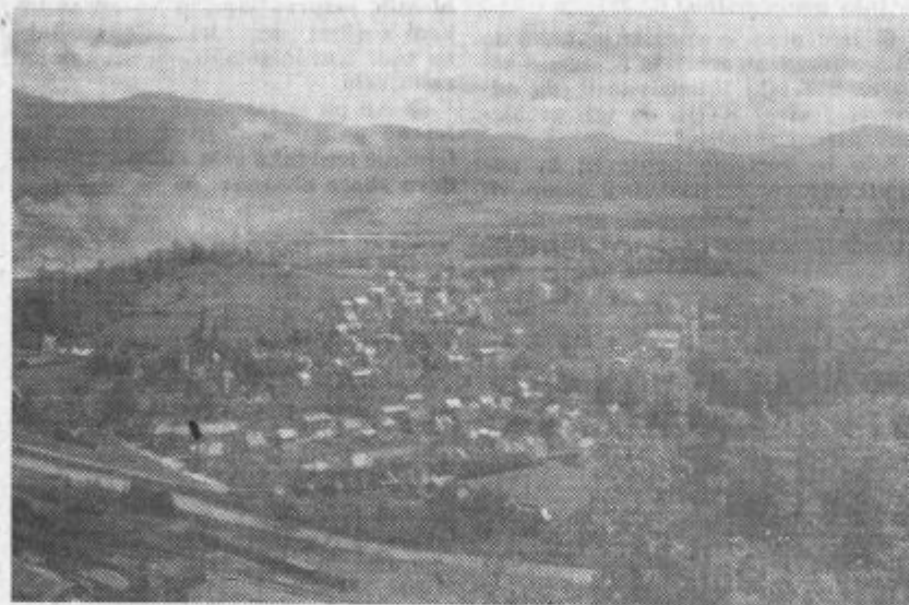
Pogled na Aljažev hrib