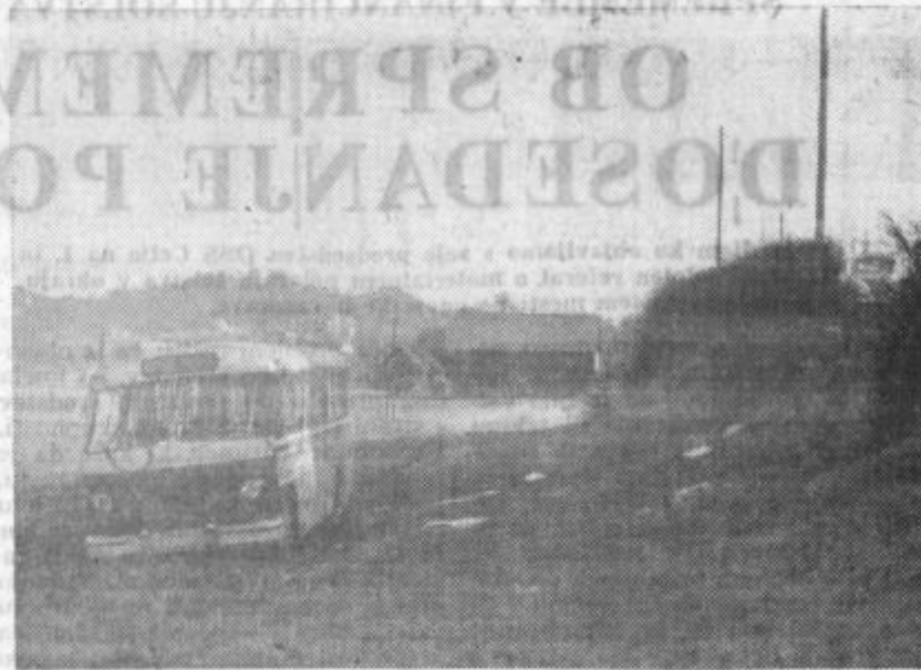
Sreča, da karoserije ni zmečkalo

Perutnine je dovolj samo ob sobotah. Toda tudi to je razveseljujoče dejstvo, saj je pred leti tudi ob teh dneh ni bilo.