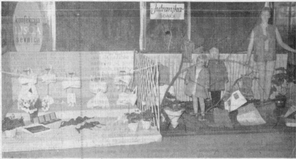
Na nedavni gospodarski razstavi sevniške občine je sodelovala tudi JUTRANJKA s svojimi kakovostnimi proizvodi.

ve, ekonomsko srednjo šolo, tehnično srednjo šolo, študijsko knjižnico in lesno industrijski kombinat Savinja. Zanima nas, kaj bodo v teh delovnih organizacijah zdaj rekli organi delavskega in družbenega samoupravljanja. Ali bodo poklicali na odgovornost ljudi, ki bi bili morali urediti dokumentacijo? Se bodo morda zadovoljili samo s sodbo sodišča? Ali pa bodo celo ugotovili, da občinska skupščina »nimá razumevanja za potrebe kolektiva in širše skupnosti«!