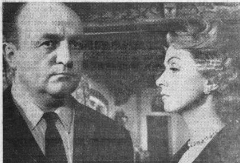
Prizor iz Duvivierovega filma Marie Octobre, v katerem bomo videli zna-menita igralca — Danielle Dariux in Bernarda Bliera (na sliki)