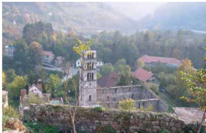
Slika 12: Pogled na ostatke crkve sv. Marije i zvonik sv. Luke, Jajce; snimak iz 2005.

Nakon velikog požara 1832. godine građevina više nije služila kultu. Reducirana je na perimetralne zidove s čitljivim tragovima da je prvobitno bila crkva, a poslije džamija. Na objektu su vršena istraživanja i manji konzervatorsko-restauratorski radovi. Veci sanacioni radovi obavljani su samo na zvoniku sv. Luke, dok ostaci crkve godinama odolijevaju različitim nepogodama. Početkom XXI stoljeća odlučeno je da se ansambl revitalizira u multikulturni centar metodom integracije staro-novo. Provedena su dva natječaja koja, po kulturno dobro takvog značaja, nisu rezultirala primjerenim rješenjima. Bilo je očito da sudionici natječaja nisu imali dostatna znanja o zaštiti, očuvanju i revitalizaciji kulturnog naslijeđa. Godine 2005. izrada