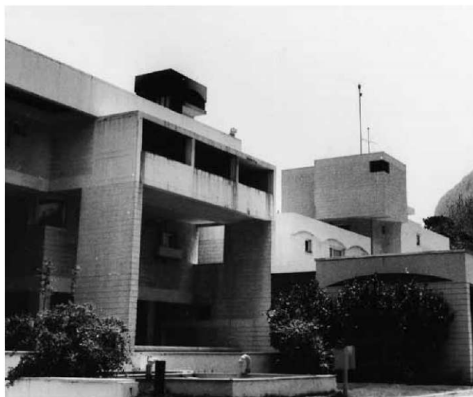
Slika 10: Hotel "Ruža" izuzetna integracija staro-novo u povijesnoj jezgri Mostara. Artikulacija arhitektonskih struktura i povijesnog okruženja provedena je s osobitim umijećem (1979., arh. Zlatko Ugljen).

novog Hotela "Ruža" je obustavljena sve do iznalaženja rješenja koje će predstavljati primjerenu integraciju staro-novo. Sud eksperata za svjetsko nasljeđe dobro ilustrira razinu devastacije prostora: "Novi Hotel Ruža, sagrađen 2005. godine, u suprotnosti s Management Planom i svim tehničkim i moralnim normama vezanim za zaštitu historijskih urbanih zona, uzrokuje golem negativan utjecaj na izrazitu univerzalnu vrijednost, autentičnost i integritet Svjetskog kulturnog dobra... Nova hotelska zgrada ni u jednom slučaju ne može biti interpolirana i uklopljena u urbani historijski dio grada Mostara upisanog na Listu svjetske baštine, ne samo zbog svoje neintegracije u okruženje nego i zbog predloženih estetskih vrijednosti... Negativna slika i utjecaj ovog teškog objekta na nacionalnu i internacionalnu zajednicu bi trebala služiti kao pouka." Ovom komentaru nije potrebno ništa dodati.