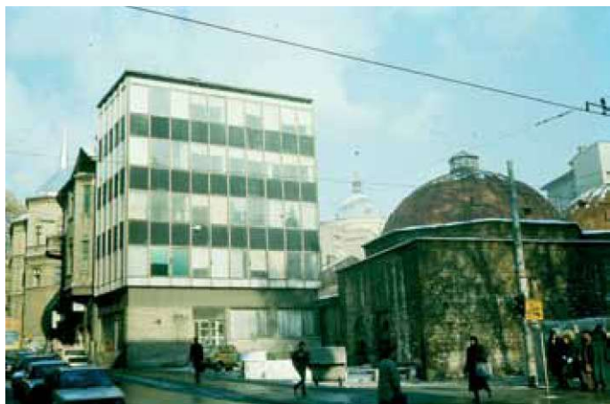
Slika 2: Zgrada RO "Plan" (1960.-61., arh. Esad Kapetanovic), Sarajevo, izgrađena u internacionalnom stilu tik uz stari hamam odražava potpun sukob s okruženjem.

objekt u pseudo secesijskom i modernom izričaju. Suvremeno koncipiran armirano-betonski korpus građevine projektanti su "ogrnuili" zidnim plaštom sa secesijskom dekoracijom i ostakljenom transparentnom kosom ravni, nagnutom prema hamamu - pristup anakron i karikaturalan, koji koketira sa dva stila. Lažno povijesna dekoracija trebala bi biti nadomjestak za srušeno i nepovratno izgubljeno, a velika staklena kosa ploha odražavati suvremene oblikovne tendencije. Očitovani formalizam apsolutno je neprimjeren u vremenu i u prostoru. Reprezentativni i javni sadržaji Bošnjačkog instituta smješteni su u za to adaptirani hamam. Uredjenje njegovog enterijera podredilo se ukusu investitora, a ne principima struke. Povijesnoj građevini data je neprimjeren raskoš i pseudo stilska dekoracija, što je u suprotnosti s odlikama nekadašnjeg javnog kupališta. Nije potrebno posebno isticati da je autentičnost jedna od najbitnijih odlika povijesnog graditeljstva.