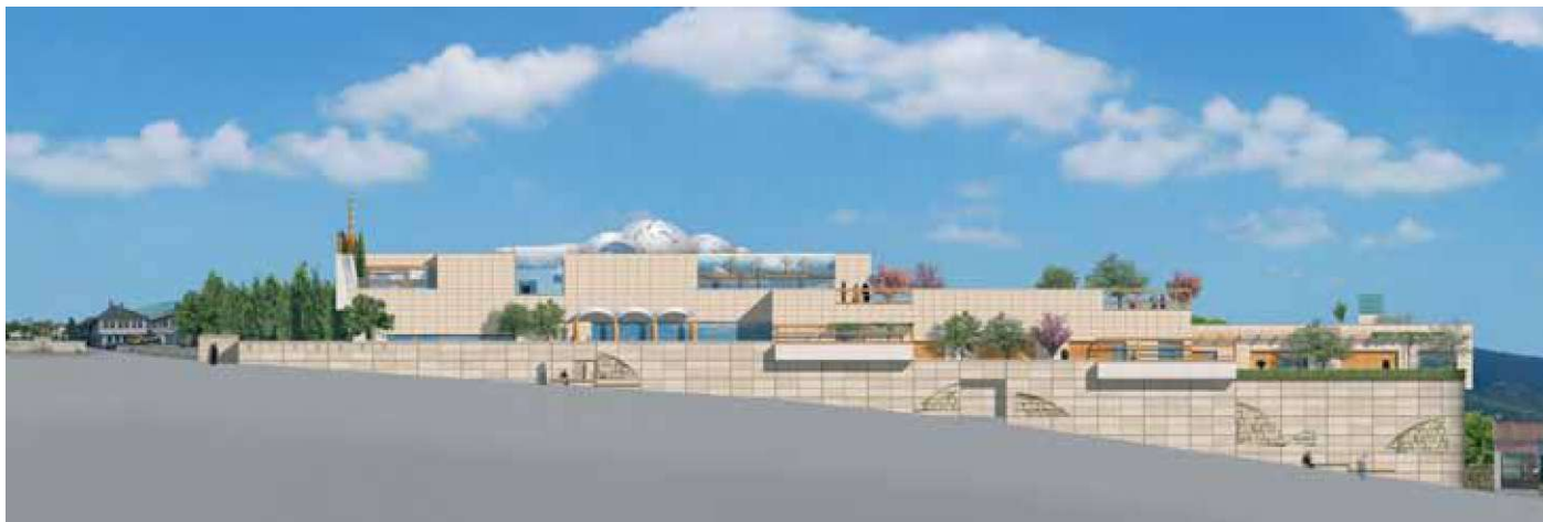
Slika 9: Karakteristična fasada za zgradu RIJASETA (projekt), za koju je temeljni kamen položen u rujnu 2008. (arh. Zlatko Ugljen).