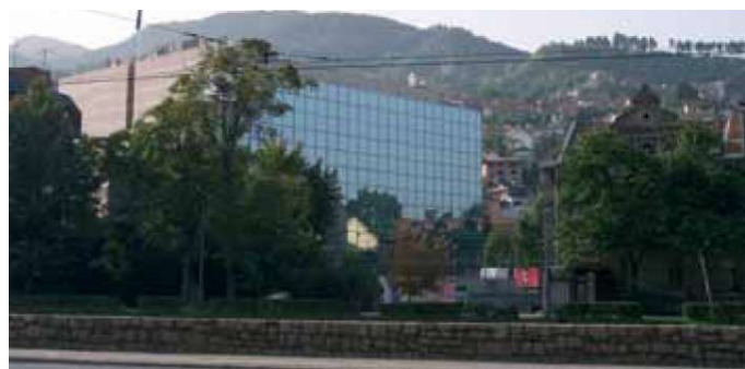
Slika 1: Nekoliko stambenih objekata iz austrougarskog doba je srušeno da bi se na njihovom mjestu izgradila pretenciozna i agresivna zgrada Europske Unije (2008., arh. Nihad Babović), Sarajevo.

U obuhvatu kulturno-povijesne i ambijentalne cjeline Sarajeva suvremena arhitektura nije svagdje jednako zastupljena. Na području stare čaršije ona još uvijek nije izborila pravo prisustva. Nove gradnje su, uglavnom, pseudostilskog izričaja. U dijelovima povijesne jezgre, gdje prevladava arhitektura zapadnoevropskoga kulturnog kruga, odnosno iz vremena austrougarske uprave, suvremeno je gradnje već odavno prisutno. Ono je, u većini slučajeva, prouzročilo nesklad starog i novog, odnosno nemjerljivu degradaciju povijesnog ambijenta.