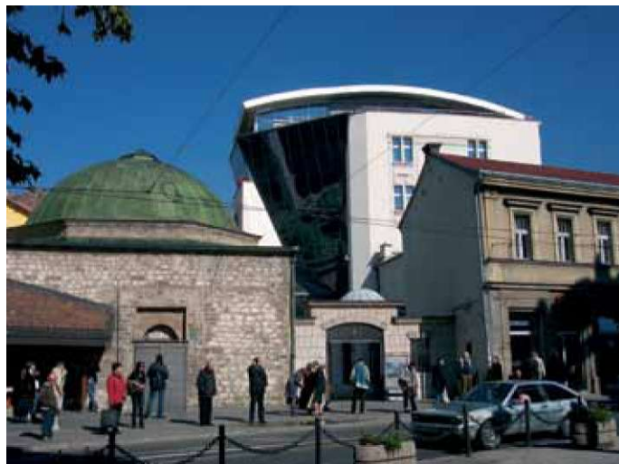
Slika 3: Nove strukture građene u stilu "falso storico" degradiraju kako stari hamam tako i cijelo okruženje. Kosa staklena ploha nije artikulirana s ostalim dijelovima ansambla. Ona odražava nedostatak temeljnih znanja i kreativnosti. Ansambl Bošnjačkog instituta upotpunjuju pseudostilski ducani dograđeni uz hamam, ograda s metalnom kapijom i turbe utemeljitelja institucije.