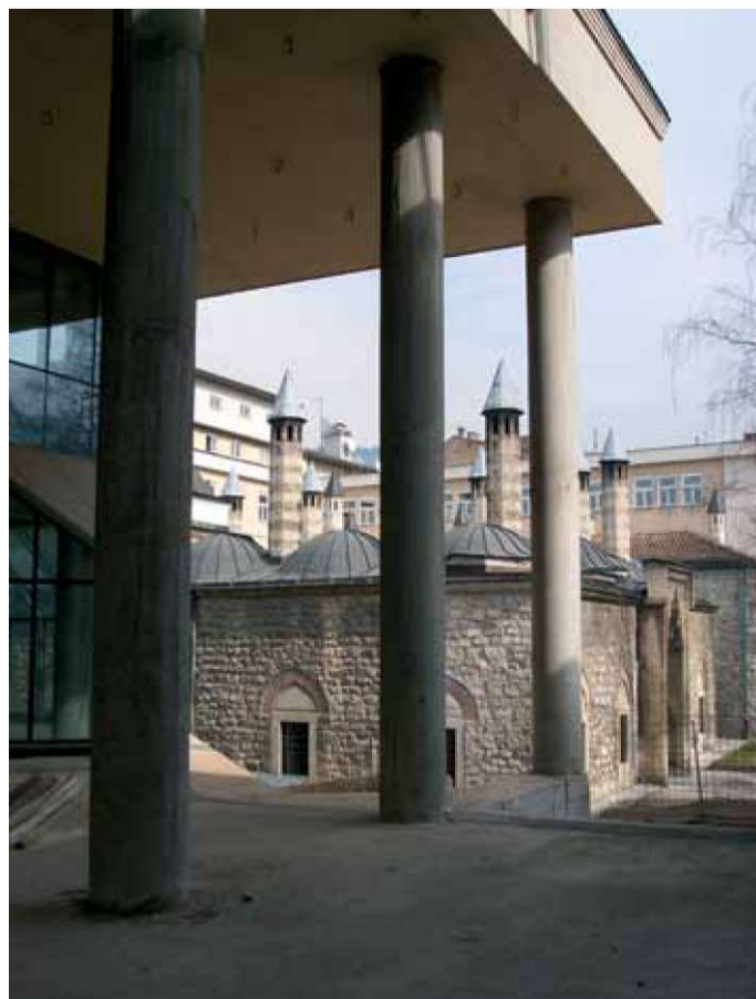
Figure 5: The view of the most significant historical building in Bašćaršija, the multi-zone domed Bey's Mosque and the newly erected Gazi Husrev Bey's Library (2008, arch. Kenan Sahovic), the dome of which degrades the urban and spatial relationships of the urban protected area.

Slika 6: "Zarobljena" masivnom strukturom nove biblioteke, Kuršumli medresa, biser osmanske arhitekture, nesaglediva je i degradirana. Nadvisuju je visoki armirano-betonski stupovi i masivne grede. Sve to zorno svjedoči o nedostatku senzibiliteta za nasliedene povijesne vrijednosti.