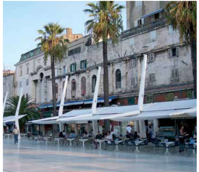
Slika 14: Monotoni niz robustnih metalnih „jarbola" - nosača tendi „štekata" degradirao je cijelu Rivu, a posebice Dioklecijanovu palaču. Osjećaj nelagodje i odbojnosti prouzročilo je opločanje u blještavom „tehnobetonu".

Naglašeni „modernizam" u postupku obnove splitske Rive ne bi trebalo a priori osuditi. On bi bio prihvatljiv da nije pretenciozan, nametljiv i da nije degradirao njene temeljne vrijednosti. Ugrozio je ponajviše samu Dioklecijanovu palaču, kao i sve one dobro znane ugodaje koji su taj prostor činili posebnim i ugodnim tijekom cijelog dana i u svim godišnjim dobima.