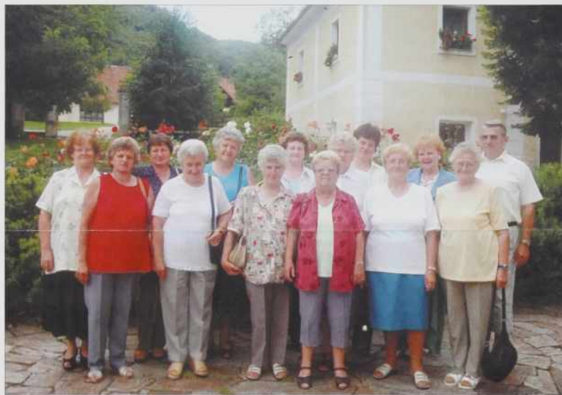
Varaške pevke pred cerkvijo sv. Jurija v Slovenskih Konjicah