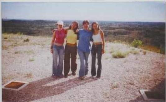
Parabske deklice na likovni koloniji v Doberdobu

kedeni dni na tajnskom, stero so se dobro pa brž gor najšle daleč od svojoga dauma. Men-