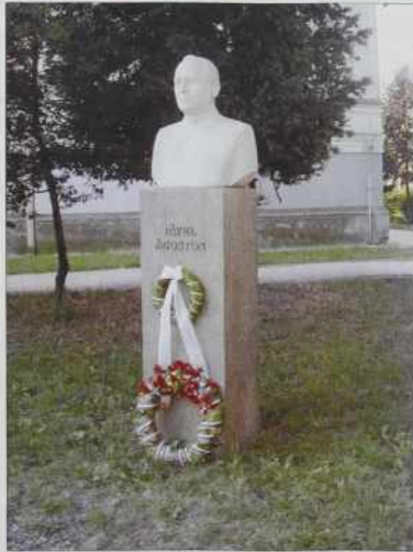
Kip Avgusta Pavla pred Muzejem Savaria

bridkost / ob davnih grobo- vih in novih mejah? / Kdo bo prislulnil nemim krikom groze, / hlipa- nju zvodenele krvi?! / In kdo bo občutil, kdo bo vedel, / da so na državnih mejah čuječi kamni / samo drug k druge- mu vabeče / bratske in pri- jateljske ponu- jene, proseče, ohromele ro- ke?!..”