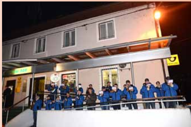
Godba Vodice je obiskovalce pospremila v dvorano.

Goste in željne poslušanja zborovskega petja je pred vhomom v dvorano pozdravila Godba Vodice. Večer so s prisotnostjo popestrile tudi narodne nože iz Društva narodnih nož in kočijažev občine Vodice. Svoj kanček prazničnosti pa so seveda dodali obiskovalci v dvorani.