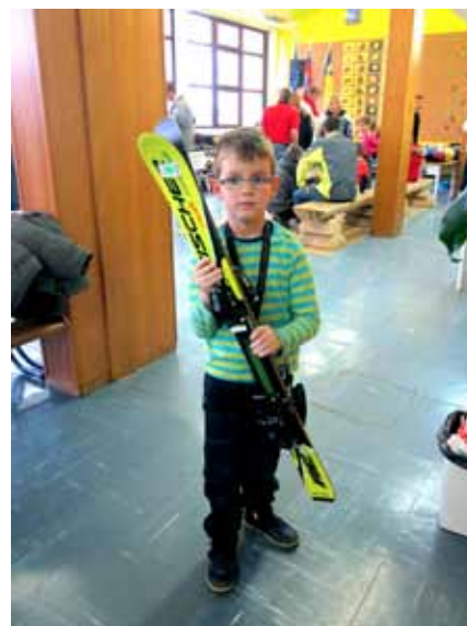
Dobre bodo, še sneg!!!

Letos smo imenu našega sejma dodali besedo "dobrodelni". Nekateri ste nas