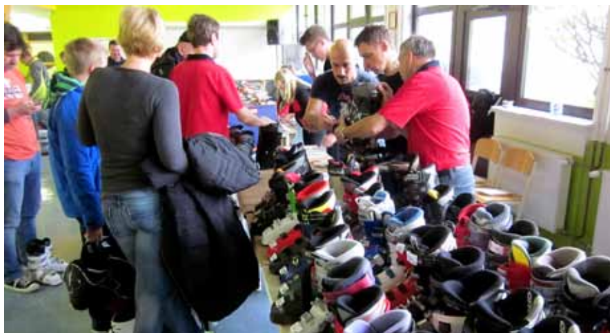
Čevlji so vedno pomembna izbira.

Besedilo in foto: Jure Marenče, Smučarsko društvo Strahovica