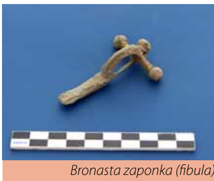
Bronasta zaponka (fibula)

Po pridobitvi kulturnovarstvenega soglasja so arheologi v ponedeljek, 24. 11. 2014, pričeli s pripravljalnimi deli za arheološka izkopavanja. Ta so zajemala strojni odziv humusa na površini dobrih 5600 m 2 in so se zaradi slabega vremena zavlekla s predvidenih štirih na osem dni. Ročno izkopavalno delo se je pričelo v ponedeljek, 8. 12. 2014, in je že takoj dalo pomembne rezultate, ki so v veliki meri potrdili izsledke georadarskih raziskav. Na trenutno izkopanem področju (fizična dela intenzivno