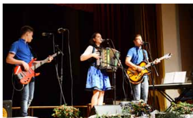
Ansambel Marcela IN je ogrel publiko v dvorani.