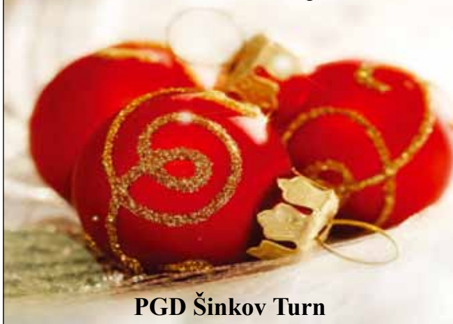
PGD Šinkov Turn

Želimo vam miren Božič v krogu najbližjih, v Novem letu pa moč, da bi vedno našli pravo pot, odprte oči za najmanjše dobrote in široko srce za vse okrog vas!