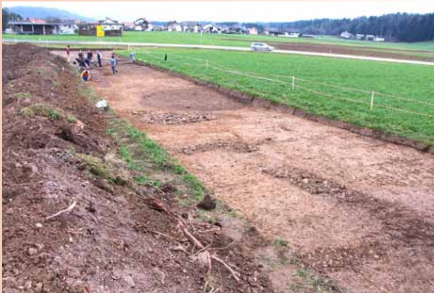
Vidni ostanki temeljev rimskodobnih objektov

Na območju prihodnjega občinskega središča v Vodicach je v teku izvedba arheoloških raziskav, kar ste mnogi tudi že opazili na terenu. Na podlagi izbora na javnem razpisu je bilo za izvedbo raziskav izbrano podjetje Magelan skupina d.o.o. iz Kranja. Arheološke raziskave se izvajajo v okviru aktivnosti za ureditev prihodnjega občinskega središča in zajemajo del območja občinskega središča, na katerem se predvideva ureditev Kopitarjevega centra ter nove prometne infrastrukture z novo interno cesto in parkirnimi površinami. Z izvedbo dodatnih arheoloških raziskav se bo območje ustrezno pregledalo in »sprostilo« za nemoteno pridobivanje gradbenega dovoljenja za objekte v okviru občinskega središča.