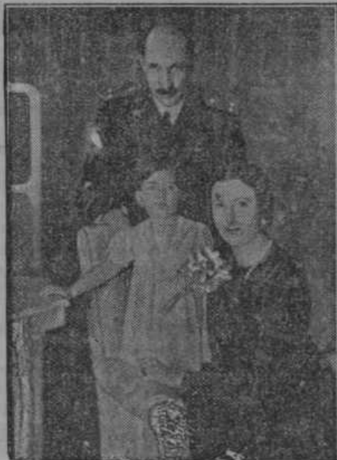
Bolgarski kralj v krogu svoje družine.