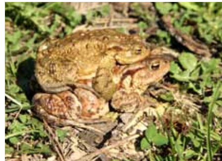
Samec in samica: Samica krastače nosi samca na hrbtu vse do bajerja, zato še toliko težje dovolj hitro prečka cesto.