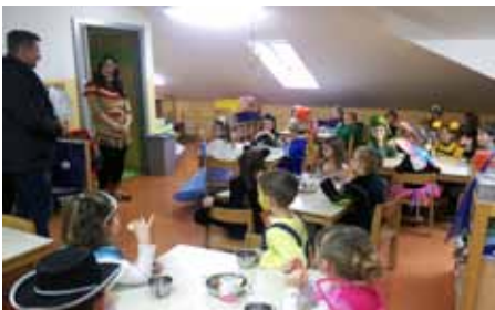
Pustne šeme v vodiškem vrtcu.