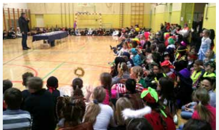
Županov pozdrav številnim maskam v OŠ Vodice.