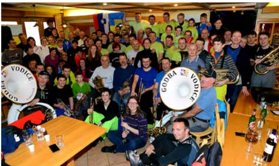
Udeleženci in organizatorji 12. Veleslaloma za Pokal OV in 3. Pohoda na Krvavec

kreacijsko-turističnemu centru Krvavec in Smučarskemu klubu Triglav Kranj.