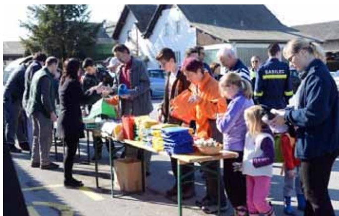
Prevzem vrečk in zaščitnih ne enem izmed zbirnih mest

V soboto, 2. aprila 2016, bo v občini Vodice potekala tradicionalna, že 17. čistilna akcija. Kljub temu, da je občanom omogočeno brezplačno odlaganje raznovrstnega odpada v Začasnem zbirnem centru Vodice za ločeno zbiranje odpadkov, nekateri še vedno odpadke deponirajo v gozdove.