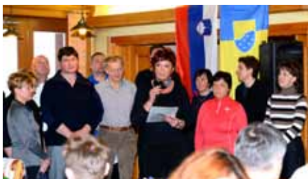
Mešani pevski zbor Biser

Kot vsako leto so se tudi letos 8. februarja smučarji, deskarji, pohodniki in drugi udeleženci zbrali pod Krvavcem na 12. Veleslalomu za Pokal Občine Vodice in 3. Pohodu na Krvavec. Tradicionalni športni dogodek ob slovenskem kulturnem in državnem prazniku se je začel z glasbo Godbenega društva Vodice, ki se je na vso moč trudilo, da bi pregnalo dež in oblake. Kljub prešerni