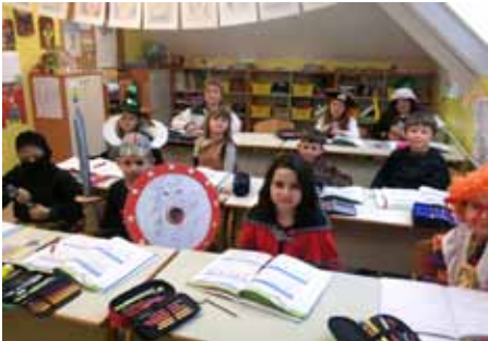
Podružnična šola Utik