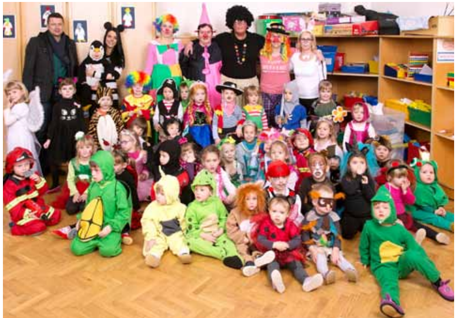
Župan, otroci in vzgojiteljice v vrtcu na Skaručni.