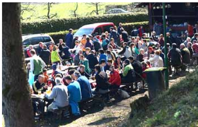
Pogostitev udeležencev lanske čistilne akcije