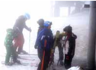
Najbolj pogumni so se kljub slabemu vremenu vseeno spustili nekajkrat po smučišču.

Občina Vodice se še enkrat zahvaljuje Športnemu društvu Victoria Club Vodice, Športno-planinskemu društvu Gams, Godbenemu društvu Vodice, Mešanemu pevskeemu zboru Biser, Re-