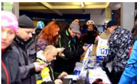
Registracija smučarjev in deskarjev pred odpovedjo tekme.

volji vseh zbranih so se vremenske razmere zelo poslabšale in postavljalci veleslalomске proge so se odločili, da tekme ni mogoče izpeljati. Vseeno so se pohodniki pogumno odpravili peš proti vrhu, drugi udeleženci pa so se odpeljali s kabinsko žičnico. V Hotelu Krvavec je bilo že vse pripravljeno za kulturni program, kjer so člani Mešanega pevskega zbora Biser in Godbenega društva Vodice tako odlično izvedli svoje točke, da so k poslušanju privabili tudi hotelske goste. Ob tej slavnostni priložnosti je župan pozdravil vse zbrane in v svojem nagovoru spomnil na največjega slovenskega pesnika Franceta Prešerna in