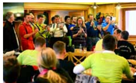
Godbeno društvo Vodice

kreacijsko-turističnemu centru Krvavec in Smučarskemu klubu Triglav Kranj.