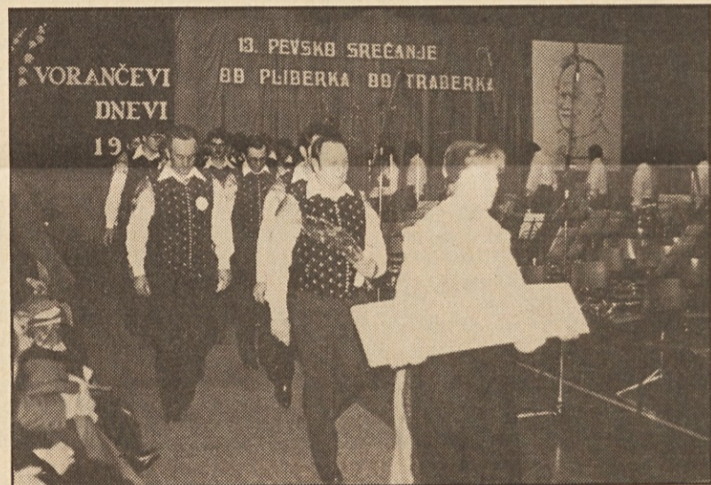
in z moškim zborom na reviji »Od Pliberka do Traberka«.