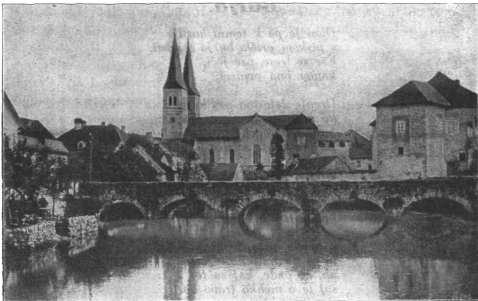
Ribniški grad in cerkev.

Neštivilno je smešnic o Ribničanu. Nekatere omenjajo njegovo pretkanost in bistroumnost, druge njegovo preprostost. Ko bi bile vse zbadljive smešnice resnične, bi Ribničan ne bil takó znan širom sveta, in reči