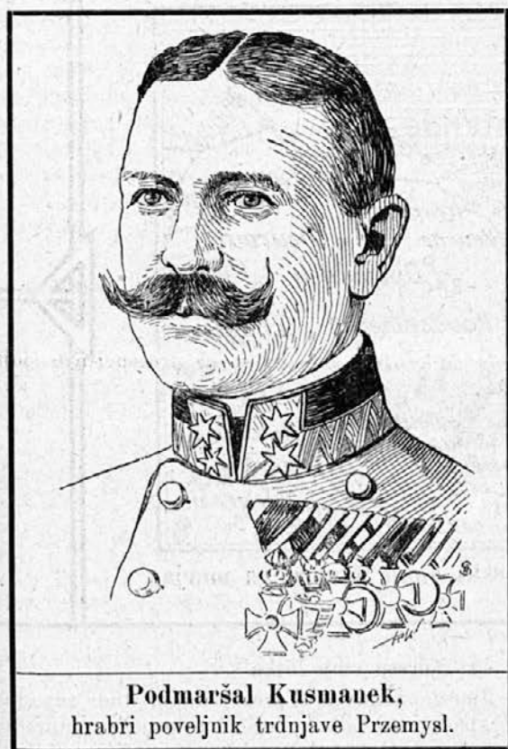
Podmaršal Kusmanek, hrabri poveljnik trdnjave Przemysl.

Na severovzhodnem bojišču stoji sedaj naše armade in močne nemške čete v malodane neprekinjeni