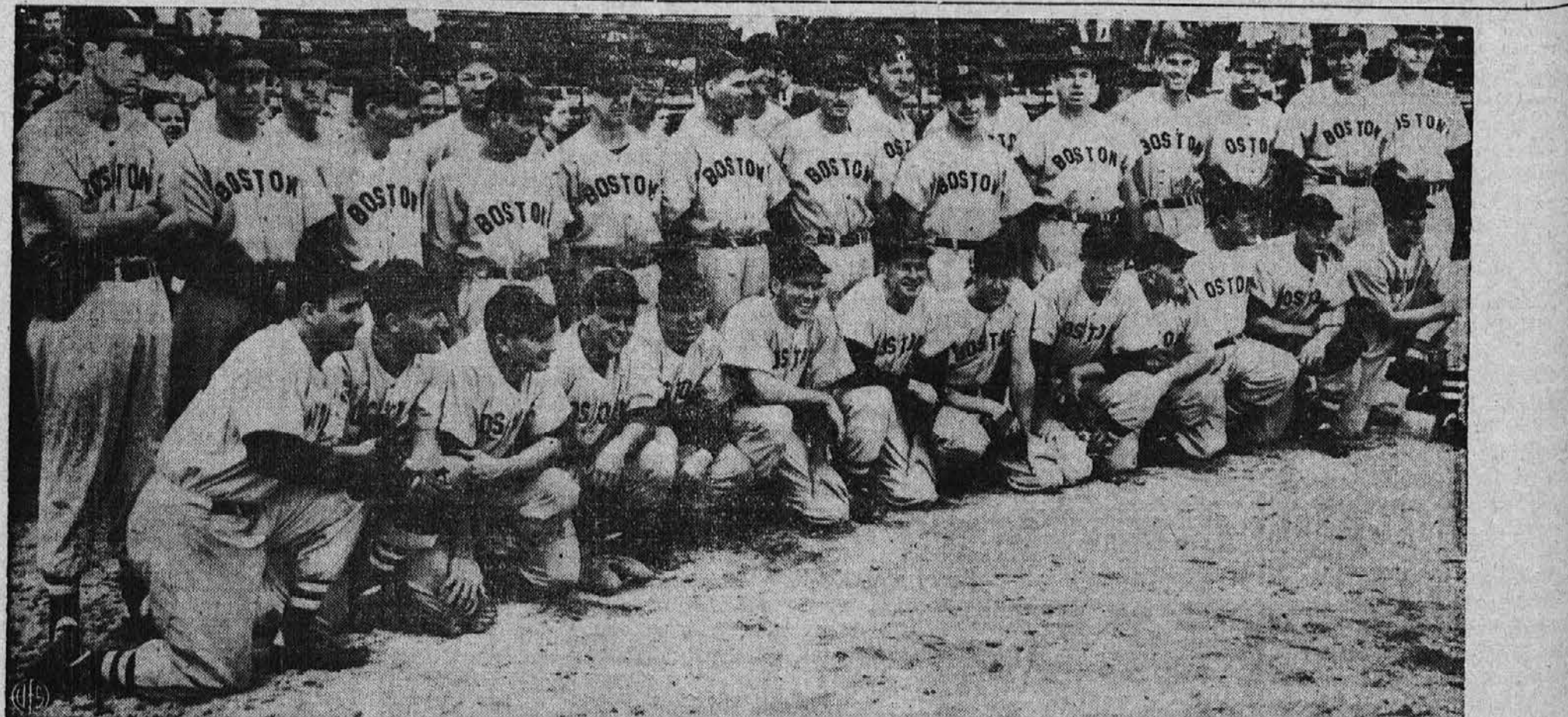
Slika nam predstavlja igralce Boston Red Sox, ki so zmagali v Ameriški ligi, in se sedaj borijo za svetovno prvenstvo z St. Louis Cardinals.