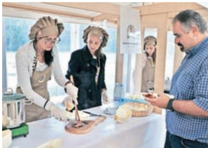
Obiskovalci festivala so lahko pokusili kranjsko klobaso dvanajstih certificiranih večjih ali manjših proizvajalcev.

Letošnji festival je imel tudi dobrodelno noto. Za degustacijo kranjskih klobas je organizator namreč prodajal degustacijske kupone (en evro za kupon) in izkupiček od njihove prodaje je šel v humanitarne namene, društvu Barka, ki v lokalnem okolju