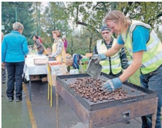
Kostanja je letos v gozdovih dovolj, pokusili ste ga lahko tudi na Kostanjevi nedelji na Katarini.

Po gozdovih okrog Katarine je letos kostanja dovolj, zato prireditev ni bila nikoli pod vprašajem. Organizatorjem je dopoldne sicer nagajalo deževno vreme, ki pa ekipam, ki so tekmoval v kuhanju golaža, ni pokvarilo dneva. Ko se je prireditev začela, tudi dežja ni bilo več – in obiskovalci so si lahko privoščili okusno nedeljsko kosilo na prostem. V tekmovanju za najboljši golaž so sodelovala turistična društva s Katarine, iz Smlednika, Pirnič, Žlebov – Marjete ter ekipi Katarinci in Od Preske do Žlebov. Obiskovalci so lahko preizkusili vse jedi in nato glasovali za eno. Največ glasov sta dobili ekipi TD Pirniče in Katarinci, ki so pripravili vegetarijanski golaž, žreb pa je nato odločil, da so zmagali domačini. Poleg kostanja in golaža je bilo na Kostanjevo nedeljo na