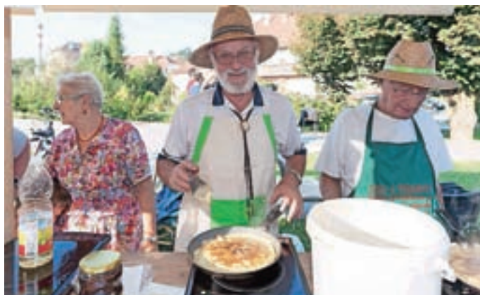
Medvoški upokojniki so pekli palačinke za vse, ki so v središče prišli peš ali s kolesom.