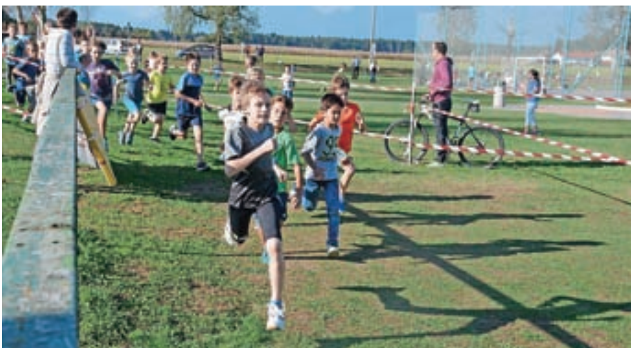
Hkrati je potekal tudi šolski občinski kros.