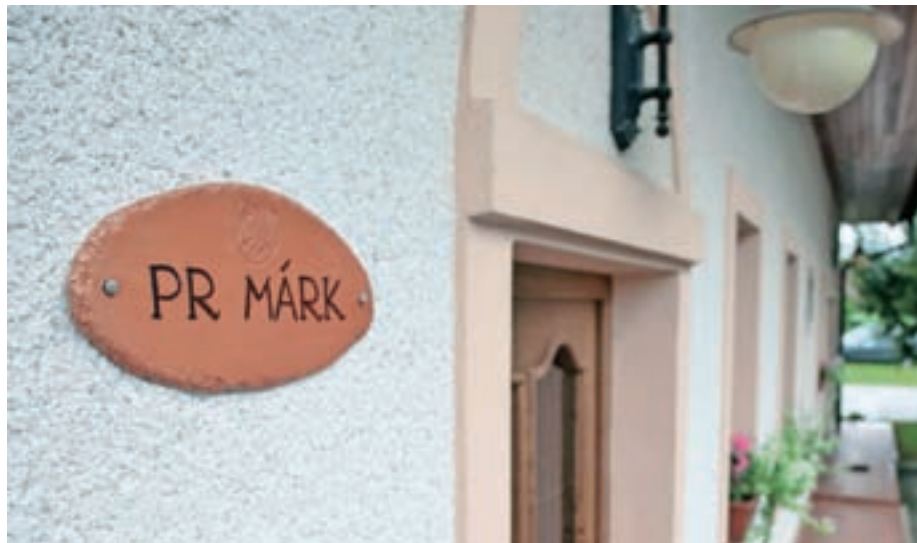
Primer table s hišnim imenom

Občane vabijo, da pomagajo pri zbiranju hišnih imen.