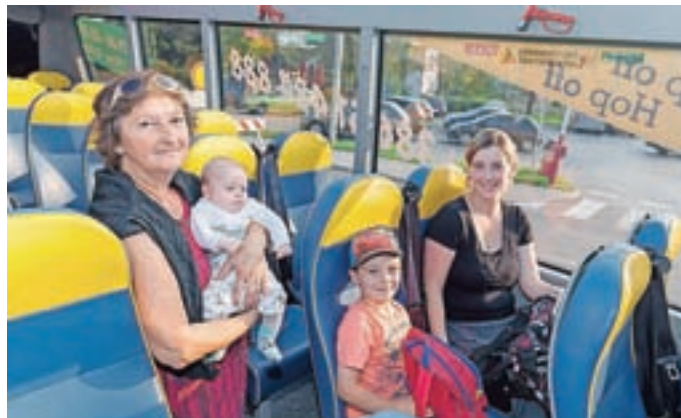
Obiskovalci so se lahko usedli v Cabrobus in se popeljali po občini Medvode. Potniki so na tak način letos spoznavali levi breg reke Sore.