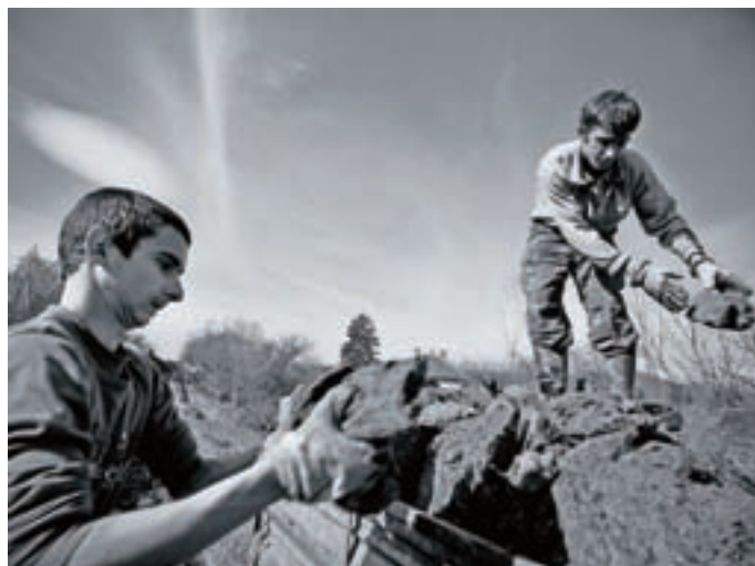
Del izpovedne serije črno-belih posnetkov, ki so nastali v živo in brez posebnih priprav

"Serija fotografij Črno zlato je nastala po naključju, ko je Srdjan Živulović kot poklicni fotoreporter v Tuzli v Bosni in Hercegovini na območju, kjer se je iskriло, spet spremljal delavske demonstracije. Februarja 2014 je nekaj tisoč demonstrantov izrazilo nezadovoljstvo nad neznoznimi družbenimi razmerami, ki sta jih povzročili divja privatizacija in korupcija. To je bila fotografova osnovna naloga oziroma tema. Ob njej pa je nekaj kilometrov stran odkril še eno, morda zanj celo bolj zgovorno in izzivalno ter človeško presunljivo. Z njo je razkril vsakodnevni trud okoliških brezposelnih in obubožanih prebivalcev, ki v odpadni jalovini iz rudnika rjavega premoga Djurdjevik s tekočim trakom odvažajo na jalovišča premog, iščejo še preostale kose, jih mukotrpno zbirajo in si z njihovo prodajo obetajo zaslužek. Živulović je iz te na videz vsakodnevne teme ustvaril izjemno človeško doživeto fotoreportersko pričevanje. Nastala je impresivna serija črno-belih fotografij, ustvarjenih v reporterskem