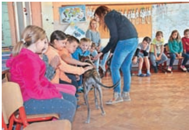
Spoznavali so tudi, kako ravnati s psi. Nad hrti so bili navdušeni.

"Eden izmed namenov Preventivnega dne je tudi, da otroci spoznajo, da je okoli nas veliko različnih organizacij, ki delajo dobro, kjer ljudje delajo veliko prostovoljno, da se lahko nanje obrneš in morda koga od teh naših otrok tudi navdušimo, da bo kasneje opravljal prostovoljno delo ali kakšen poklic v tej smeri," je še pojasnila Frankovičeva.