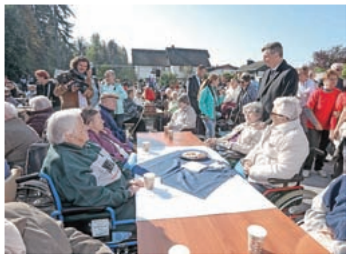
Predsednik Republike Slovenije Borut Pahor med starostniki v Medvodah