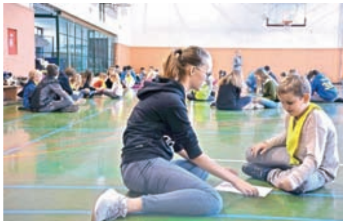
Novost na OŠ Preska je tutorstvo, ko devetošolci pomagajo prvošolcem.