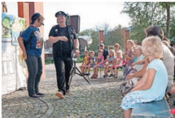
Gledališka predstava za otroke Jaka v prometu