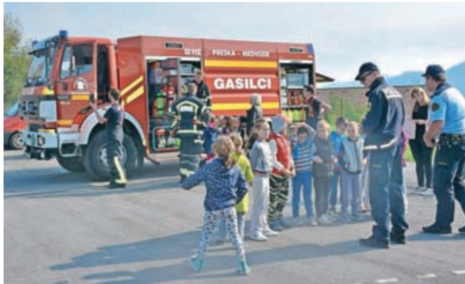
Učenci so se seznanili tudi z delom Policije in gasilcev.