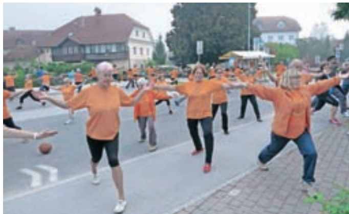
Na zaprtem delu Medvoške ceste je štiri dni zjutraj potekala telovadba na prostem. V dveh medvoških skupinah telovadi že več kot šestdeset ljudi – vsak delovni dan.

branje, druženje ... Evropski teden mobilnosti se je v Medvodah zaključil 21. septembra na dan brez avtomobila. V petih dneh so se zvrstili številni dogodki, ki se jih je udeležilo tudi veliko otrok. Dobro sprejeta novost je bil Pešbus.