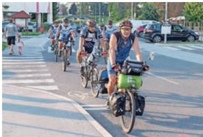
S KK Medvode na izlet po medvoških vaseh