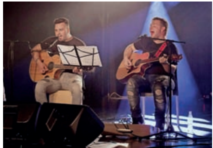
Ob jubileju je na odru Kluba Jedro nastopil duo Artcoustic.

Kot je dejal programski vodja Rok Tomšič, Klub Jedro ob vseh naštetih dejavnostih, ki jih vseskozi ponuja obiskovalcem,