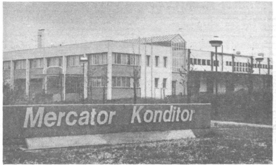
Nova tovarna omogoča znatno večjo proizvodnjo, prinaša pa tudi nove stroške. Vse to so v M – Konditorju dobro preračunali in se dogovorili, da bodo letos naredili kar 19,5 milijona kosov slaščic in peciva

»Tak skok nam ob zelo majhnem povečanju zaposlenih omogoča nova oprema, toliko je zmogljivo sprejeti tudi tržišče, le taka količina pa nam bo jamčila tudi pokrivanje vseh novih stroškov,« je pričel navajati stroškovne in proizvodne primerjave sogovornik in jih podkrepil z nekaj primeri novih stroškov, ki jih prej niso imeli.