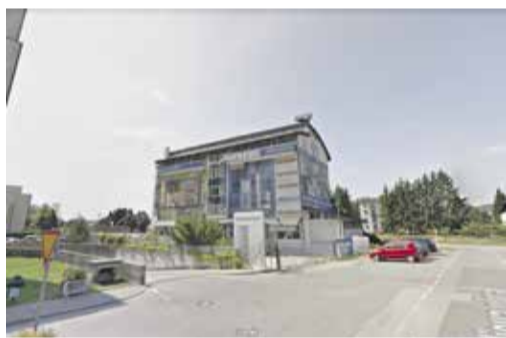
Center za socialno delo Domžale, Masljeva 3