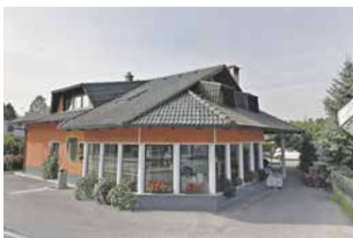
Cvetličarna Slovnik, Breznikova 56, Ihan