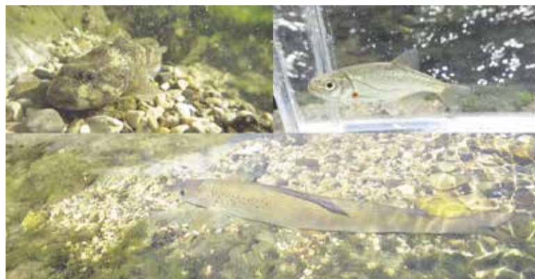
Zgoraj levo: kapelj, zgoraj desno: pisanka in spodaj: lipan

nem mestu pod izpustom pa 11 domorodnih in eno tujerodno vrsto – šarenko. Na obeh vzorčnih mestih je največ rib pripadalo družini krapovcev, najštevilčnejši vrsti pa sta bili na obeh lokacijah pisanka in kapelj. Bistvenih razlik med vzorčnima mestoma nismo zaznali niti z indeksi biotske pestrosti niti z oceno ekološkega stanja, ta je na obeh lokacijah pokazala slabo stanje Kamniške Bistrice.