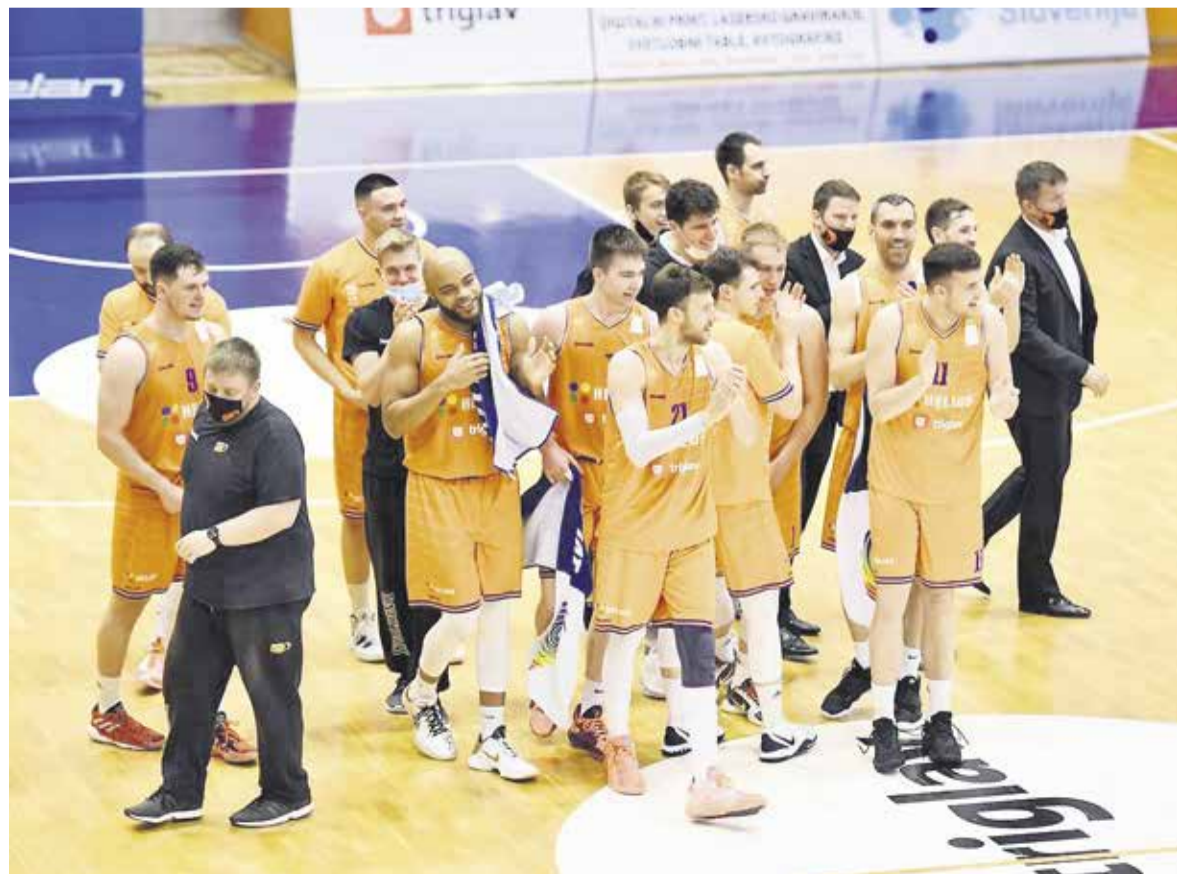
Sezona je končana – košarkarji Heliosa so v njej odigrali 47 tekem in jih dobili 21.