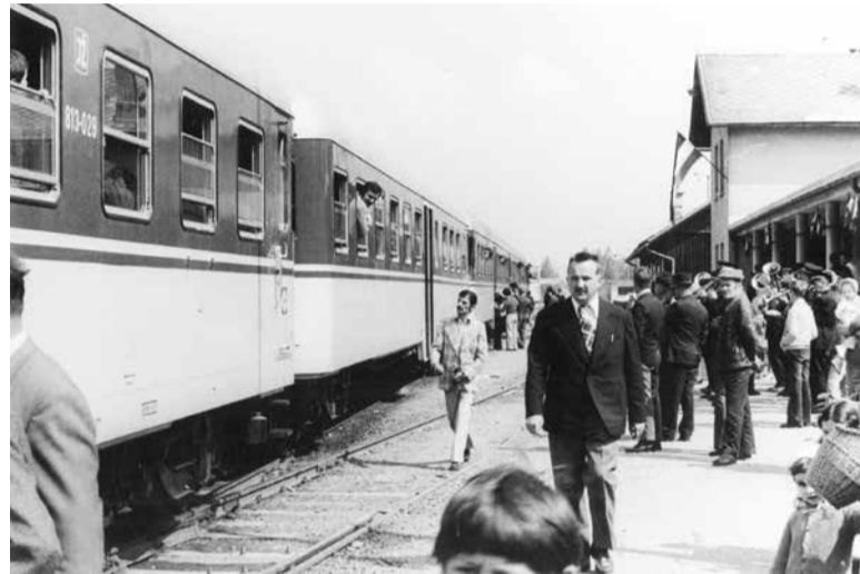
Leto 1978: vnovično uvedbo potniškega prometa so v Domžalah takrat pozdravili celo z godbo.

Vlak, ki je potegnil s črnuške postaje, je počasi zapeljal za njo, vlakovodja pa ob tem piskal na vse pretege z namenom, da kravo spravi s tirov. Krave pa piskanje vlaka ni ganilo, korak je pospešila v dir, tega pa je iz metra v meter še povečevala. Nenavadna dirka krave in vlaka za njo je spravila v krahot vse, ki so spremljali nenavadno tekmovalje. Prva je pridirjala na Ježico ob navdušenem ploskanju ljudi, ki so krototaje sodelovali v atrakciji, kakr-