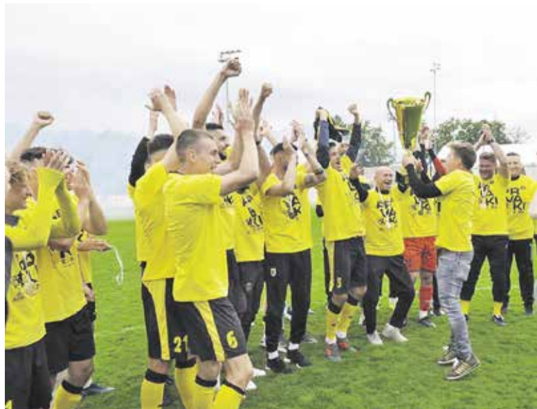
Mlinarji so zaslužno in prepričljivo osvojili drugo ligo.