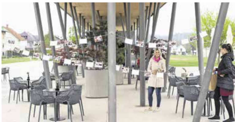
Priprave na presenečenje

OBČINA DOMŽALE, URAD ŽUPANA FOTO: ALENKA KLINAR