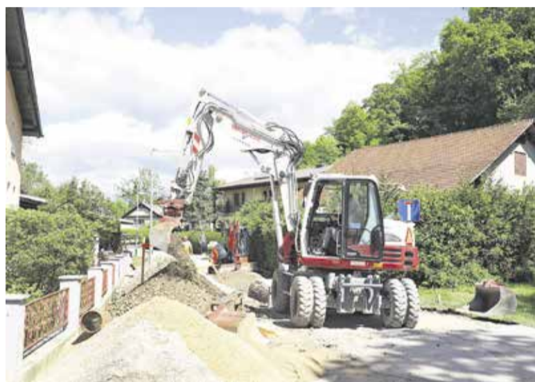
Izgradnja meteornega kanala na Poti pod hribom in Šumberški cesti

Občina Domžale začena z obnovo javne mestne površine – ureditvi jo mestnega trga pred veleblagovnico . To je osrednja površina centra Domžal, ki predstavlja vozlišče pešpoti, ki bo v prihodnje povezovala tri pomembna žarišča centra Domžal, in sicer območje SPB-1, območje Koldvorske ceste ter bodočo peš promenado do Univerzala. V petek, 21. maja 2021, smo začeli z uvedbo investicijsko-vzdrževalnih del. Načrtujemo obnovo in preoblikovanje obstoječih mestnih površin in njihovo nadgradnjo. Območje prenove obsega dotrajano asfaltirano ploščad, ki je namenjena uporabnikom veleblagovnice in družabnim dejavnostim. Oblikovna osvežitev javne mestne površine bo zajemala preoblikovanje in obnovo materialov ter dograditev urbane opreme. Ureditev mestnega trga se bo izvajala v poletnih mesecih, predvidoma tri mesece od uvedbe del. V času gradnje bo dostop obiskovalcev in uporabnikov veleblagovnice, s sprednje strani ob Ljubljanski cesti, nekoliko otežen oziroma spremenjen.