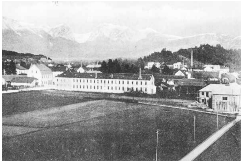
Trasa kamničana skozi Domžale sredi dvajsetih let 20. stoletja. Na desni je Godbeni dom domžalskih godbenikov v gradnji.

Po prvi ukinitvi leta 1932 so leta 1965 zaradi nerentabilnosti potniškega prometa na progi le-to ukini, proga pa je hkrati s tem posledično izgubila status javne proge za poslovno-gospodarske potrebe. S tem je kamniška proga postala le pogod-