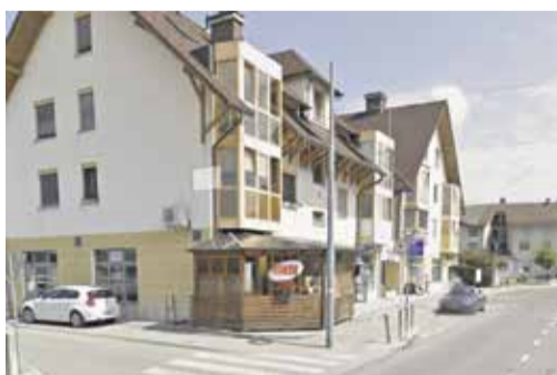
Cafe Rondo, Cesta borcev 5, Radomlje