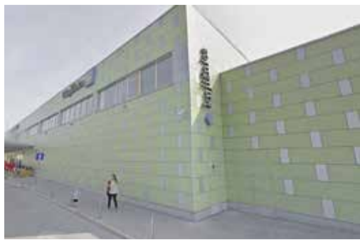
Knjižnica Domžale, Cesta talcev 4