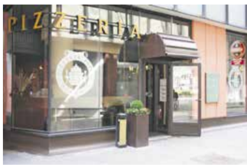
Picerija Pipca, Ljubljanska 80