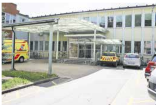
Zdravstveni dom Domžale, Mestni trg 2