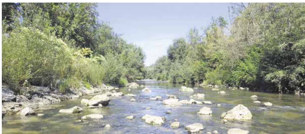
Struga Kamniške Bistrice na vzorčnem mestu pod izpustom iz CČN

Kolumne izražajo stališča avtorjev in ne nujno uredništva glasila Slamnik.