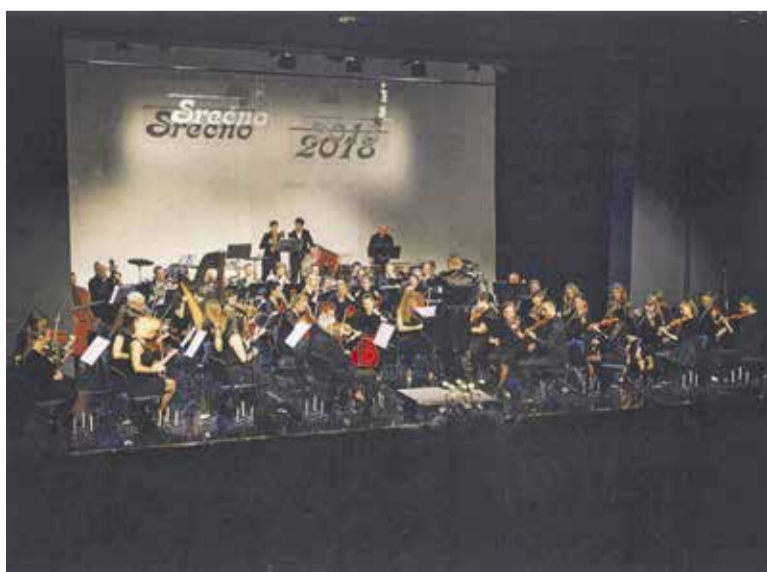
47. Novoletni koncert