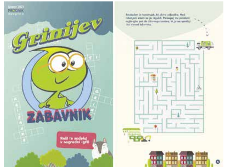
Z Grinijevim zabavnikom otroci na zabaven način ozaveščajo pomen ravnanja z odpadki in varovanja okolja.

Veseli nas, da otroci ter njihovi učitelji in starši radi sodelujejo v