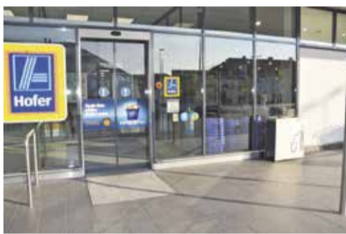
Hofer Domžale, Šaranovičeva 27 a