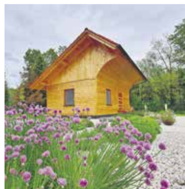
Čebelnjak pri CCN Domžale - Kamnik

Čebelarstvo je izjemno pomembna kmetijska panoga in ponosni smo, da ima na naših tleh tako dolgo tradicijo. K temu je seveda veliko prispevala želja po lokalnem organiziranju samostojnih čebelarjev v društva, ki so v našem prostoru zelo aktivna. Vanje so vključeni tudi naši najmlajši, ki na tak način spoznavajo kako zelo pomembne so čebele za naš planet. V občini Domžale skušamo čebelarjem pomagati oziroma jih spodbuditi z vsakoletnim javnim razpisom za sofinanciranje čebelarstva dejavnosti. Dober rezultat sodelovanja med čebelarškimi društvi in lokalno samoupravo je tudi naša Čebelarška