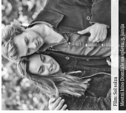
Film: Sol solza Mestni kino Domžale na spletu, 3. junija