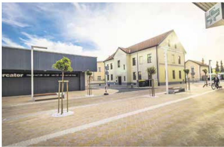
Območje umirjenega prometa v centru Domžal

Na območju mesta Domžal je bila Zelena os dopolnjena z rekonstrukcijo mosta ob vznožju Šumberka –