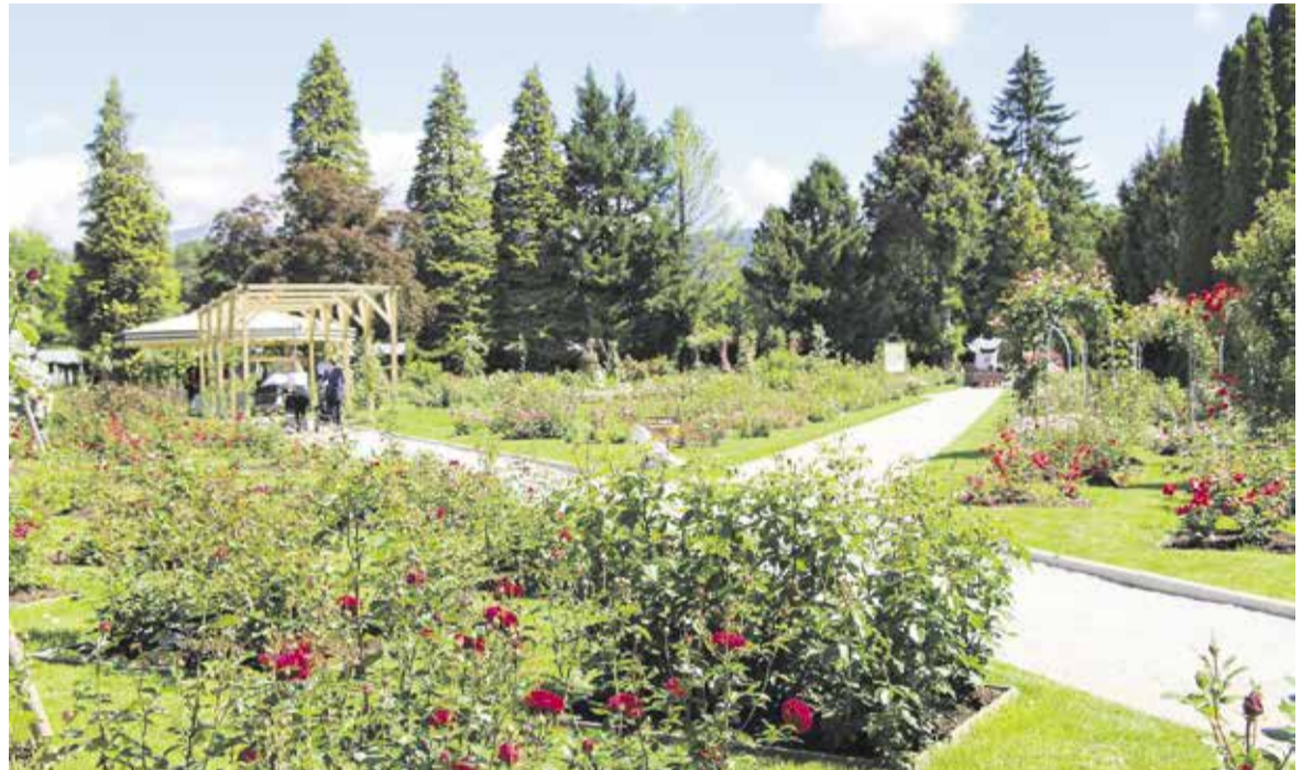
Skrbno urejeni rozarij čaka prve cvetove in Mozartovo glasbo v sodelovanju s Kulturnim domom Franca Bernika.