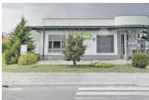
Lekarna Vir, Čufarjeva 23, Vir