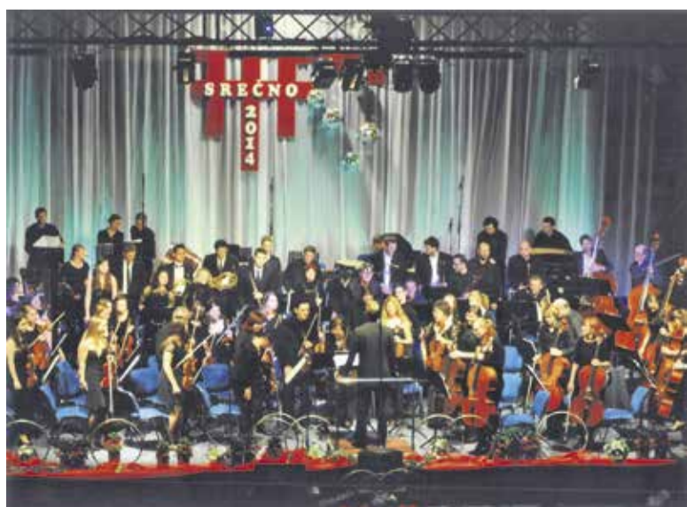
43. Novoletni koncert, 27. 12. 2013