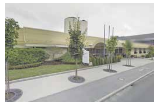
Dom upokojencev Domžale, Karantanska 5