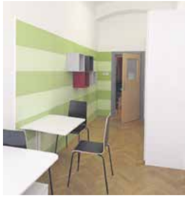
V letu 2020 je ZPM Domžale uredila svoj, sicer majhen, a pomemben prostor.

ZPM Domžale je posebno skrb namenila počitniškim dejavnostim. Najprej med zimskimi počitnicami, ko je 21 otrok, med njimi 17 iz občine Domžale, aktivno preživljajo čas v organizaciji OŠ Rodica. Med poletnimi počitnicami je za 53 otrok, večinoma iz naše občine, poskrbela OŠ Vencija Perka Domžale. ZPM Domžale je 160 pridnim bralcem in bralkam, med njimi stotim iz občine Domžale, podelila zlate bralne značke, v Tednu otroka pa pripravila bogat program z likovnimi delavnicami, ogledi mladinskih filmov in lutkovno predstavo, poskr-