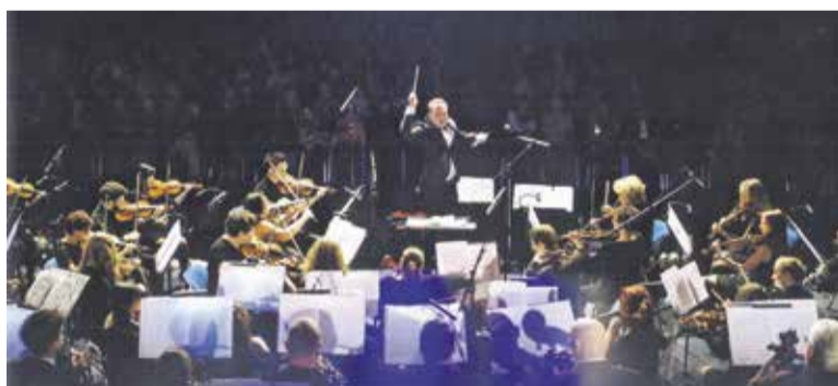
46. Novoletni koncert Domžale, 27. 12. 2016