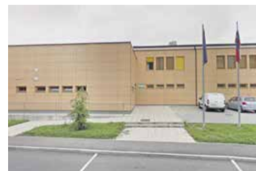
Vrtec Urša - enota Češmin, Murnikova 4