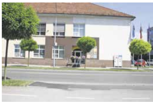
Center za mlade Domžale, Ljubljanska 58

Če bi želeli postati Unicefova varna točka, je pravi naslov za vas Center za mlade Domžale (info@czm-domzale.si, 040 255 568), kjer vam bodo razložili postopek. ☐