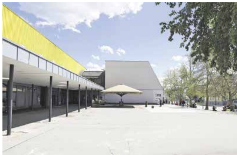
Ureditev mestnega trga pred veleblagovnico

Le z vlaganjem v naš skupni javni prostor lahko dosegamo kvaliteto bivanja v naši lokalni skupnosti.