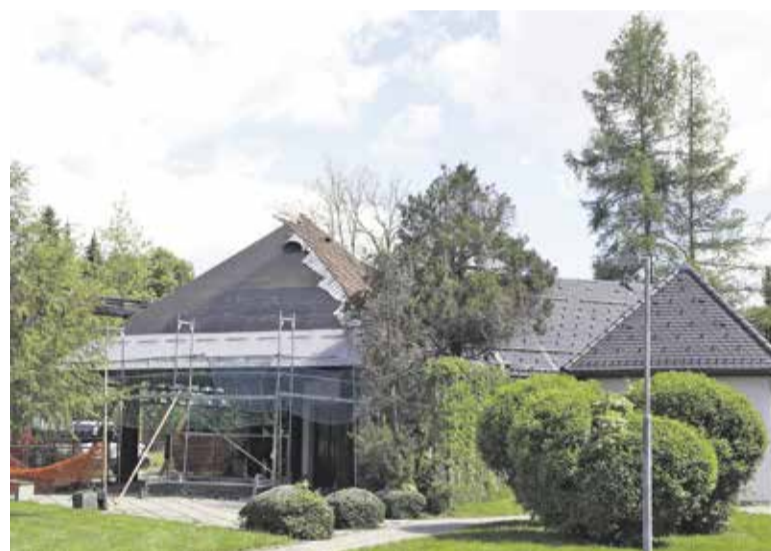
Krovna dela na poslovilni vežici v Dobu