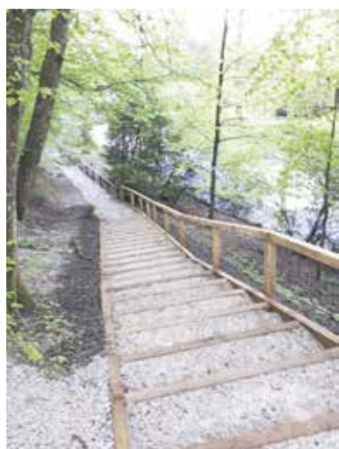
Nove stopnice, prijazne otrokom in starejšim.