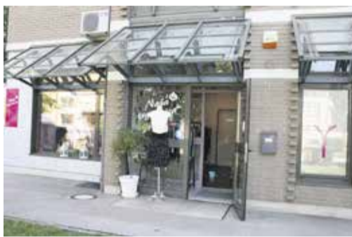
Naša trgovin'ca, Ljubljanska 104