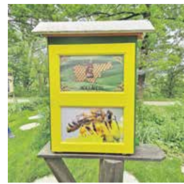
Opazovalni panj v Dobu

učna pot, ki se vije med dvema čebelnjakoma – Močilnikom in Centralno čistilno napravo.