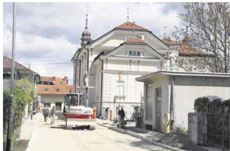
Dela na Cankarjevi ulici