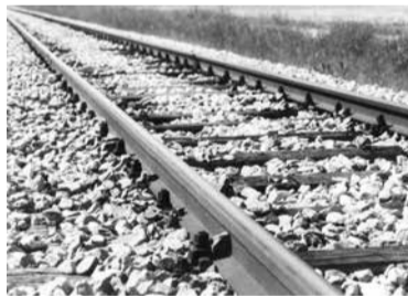
Ta tir je že 130 let speljan od Ljubljane do Kamnika.

Ena od zgodb govori tudi o vsakodnevem rednem nakupovanju. Dogajalo se je (menda!), da je na Dobravi med Črnučami in Trzinom, kjer poteka železnica tik ob cesti. Vsako jutro – to se je menda res dogajalo – je stopil vlakovodja z vlaka in kupil mleko od mlekarič, ki so bile na poti v Ljubljano vsaka s svo-