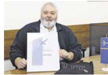
Občina Domžale – prostovoljstvu prijazna občina

Tudi Občina Domžale je z aktivnim vključevanjem postala del te pomembne zgodbe in si pridobila naziv Prostovoljstvu prijazna občina . Naziv smo dobili za: spodbujanje prostovoljstva preko javnih razpisov in z zagotavljanjem finančnih sredstev za delo mentorjev prostovoljcev v javnih zavodih oziroma organizacijah s prostovolj-