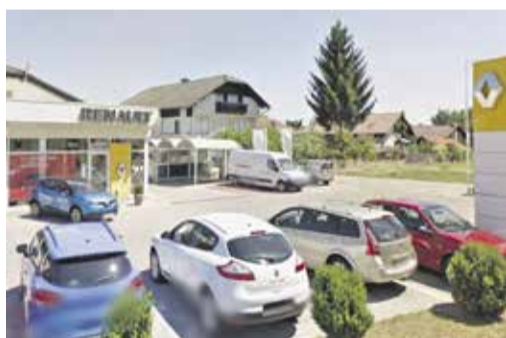
Avto Set, Dragomelj 26