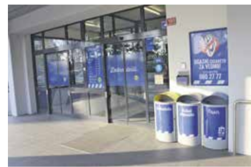
Lidl Domžale, Ljubljanska 150