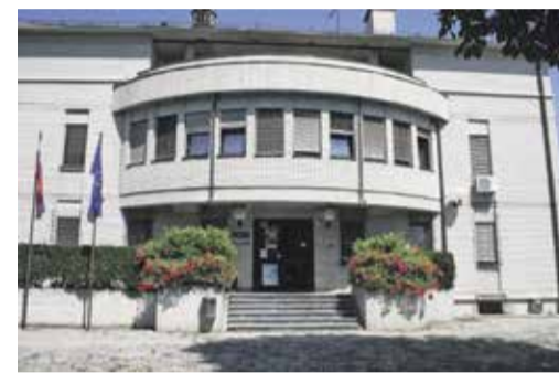
Policijska postaja Domžale, Ljubljanska 96