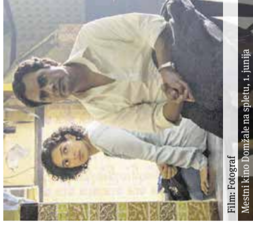
Film: Fotograf Mestni kino Domžale na spletu, 1. junija