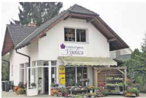
Cvetličarna Vijolica, Ulica 7. avgusta 29 a, Dob