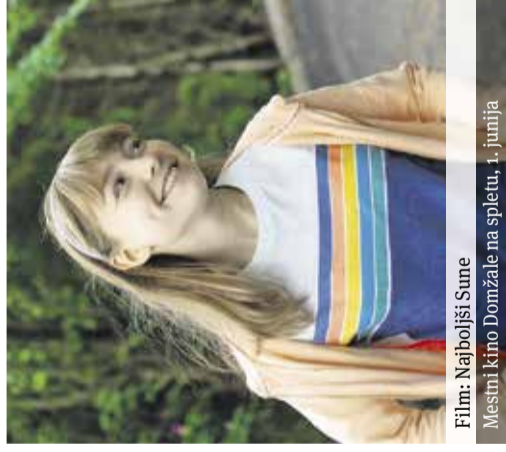
Film: Najboljši Sune Mestni kino Domžale na spletu, 1. junija