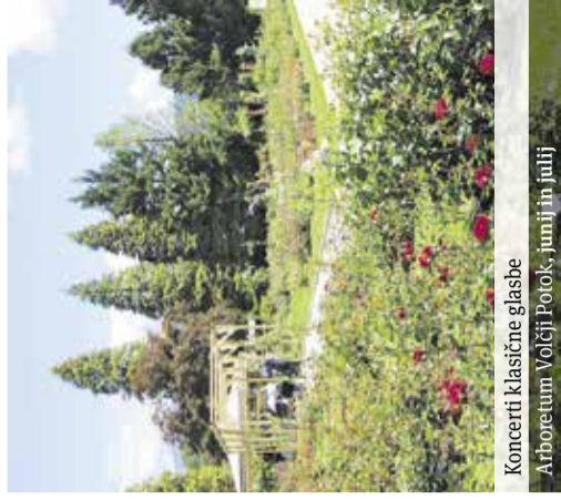
Koncerti klasične glasbe Arboretum Volčji Potok, junij in julij