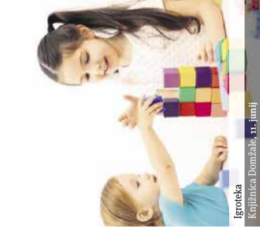
Igroteka Knjižnica Domžale, 11. junij