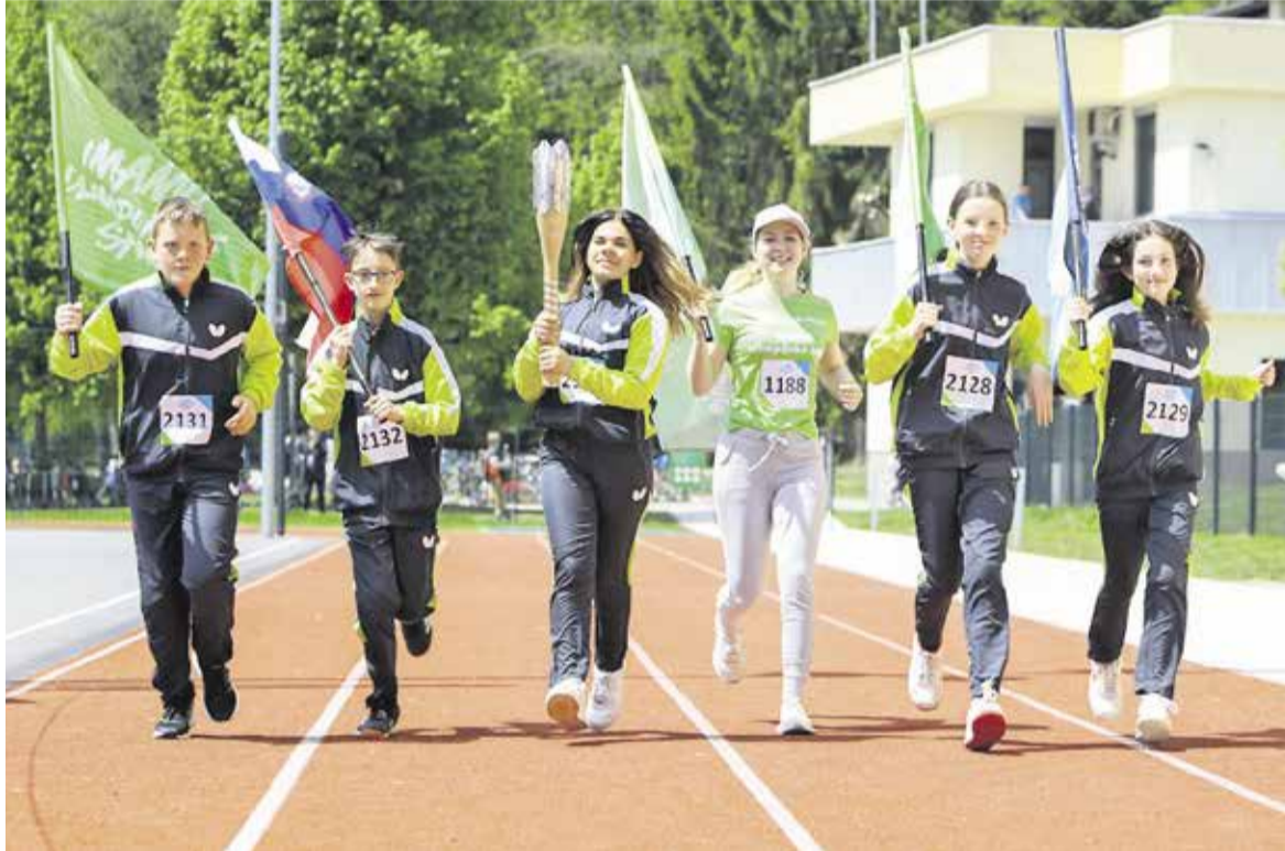
Naši mladi namiznoteniški člani in članice so takole nosili in pospremili olimpijsko baklo letošnje olimpijade, ki bo poleteli v Tokiu na Japonskem.

Končujejo se tekmovanja v slovenskih namiznoteniških ligah.