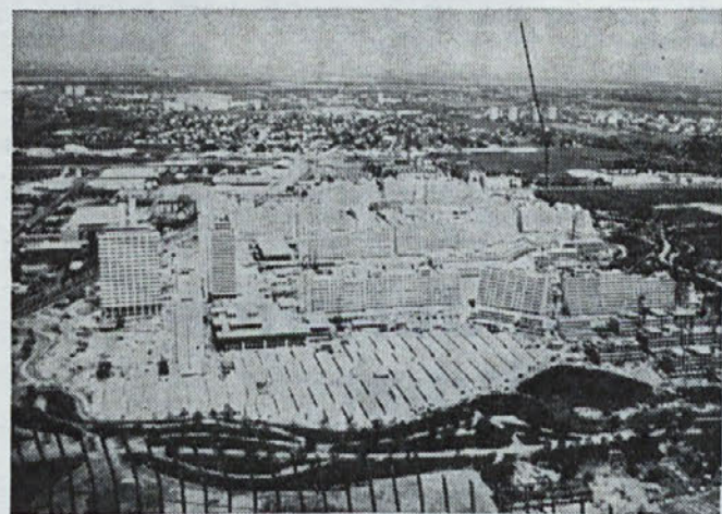
Olimpijsko naselje v Münchnu

Stavbno pohištvo kot voluminozen proizvod ne prenese dolgih transportnih poti, zato je usmerjanje njegovega izvoza v Azijo, Afriko, Severno in Južno Ameriko, Avstralijo in Oceanijo nesmiselno.