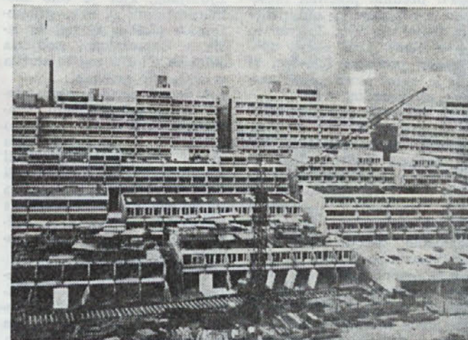
Olimpijsko naselje v Münchnu

2. Absorpcijska moč tržišča ZR Nemčije je veliko večja od absorpcijske moči jugoslovanskega tržišča. Medtem ko absorpcijsko moč jugoslovanskega tržišča ocenjujemo okroglo na en milijon oken in en milijon vrat letno, pa