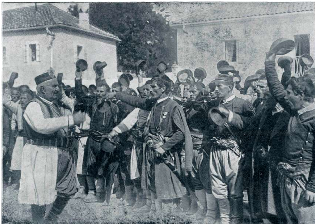
NIKOLA PETROVIĆ NJEGUŠ, KRALJ ČRNOGORSKI, POZDRAVLJAN OD LJUDSTVA

po njej revno človeštvo in pada iz zmote v zmoto in izgublja dan za dnem svoje moči? Ali se ti to revno in šibko ljudstvo prav nič ne smili? — In glej, ako bi to ljudstvo ne videlo jasne luči in krepke moči odpovedi, bi popolnoma zabredlo in izgubilo vso vero v svojo moč in bi se zavekomaj potopilo v močvirju. — Kakor šibi moči in voljo zgled slabega, tako jih krepi in jači zgled dobrega. In ker je na svetu toliko slabega, je treba tudi mnogo dobrega, in ker je na njem toliko neizmernega uživanja, je treba tudi veliko brezpogojnega zatajevanja, sicer