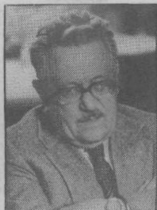
EDVARD KARDELJ 27. 1. 1910—10. 2. 1979

Tak je bil 16. januarja pogled na Proletarsko cesto v Mostah. Nekateri avtomobili so že kukali izpod snega, saj so bili lastniki previdni in so jih vsaj nekoliko odmetali. Nekateri pa so se obnašali tako, kot da so pozabili nanje, saj jih kljub opozorilom po radiu niso odpeljali drugam niti jih niso odkrili, da bi buldožerist, koo je čistil cesto videl, ali gre le za kup snega ali za avtomobil, skrit pod njim. Zato poškodovanih avtomobilov ni bilo malo.