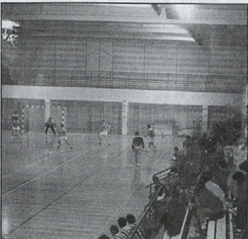
Utrinek z ene izmed tekem