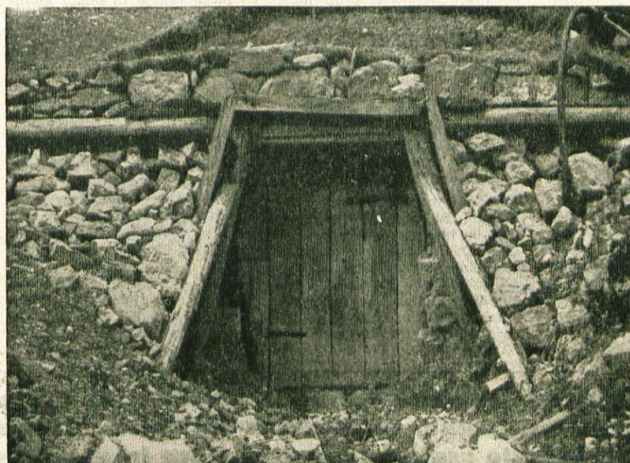
Vhod v šentanski rudnik