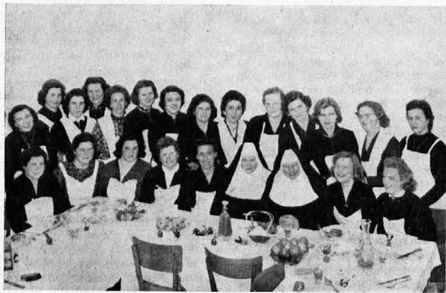
Skupina deklet kuhinjskega tečaja v Bazovici.