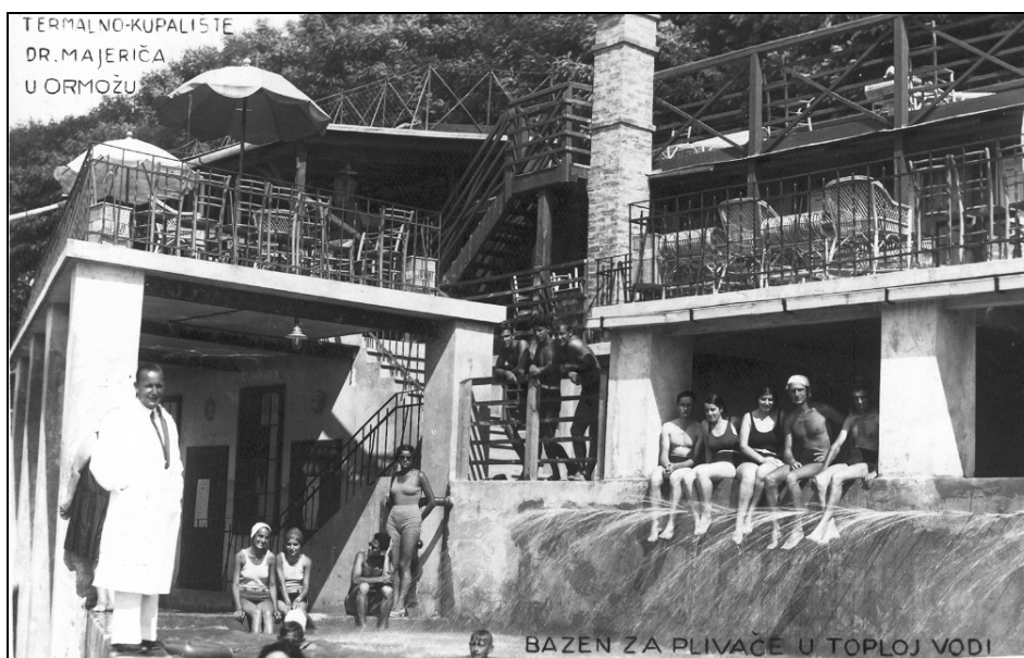
Kopališče dr. Majeriča v Ormožu. Razglednica iz srede 30. let 20. stoletja.