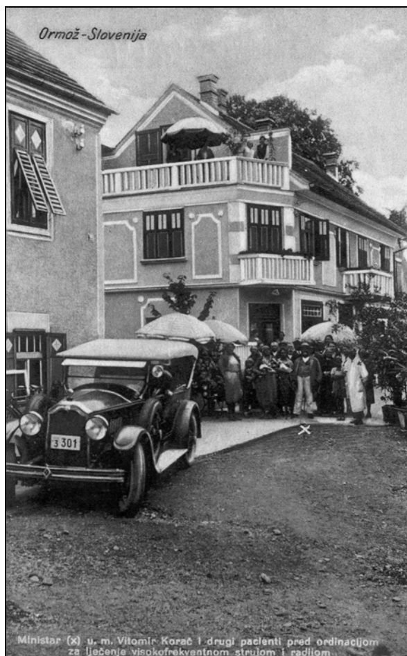
Minister Vitomir Korač (označen s križcem) in drugi pacienti pred senatorijem dr. Majeriča v Ormožu. Razglednica iz srede 30. let 20. stoletja.

Zaradi tega je bilo v Ormožu leta 1937 sprejetih nekaj higienskih predpisov, in sicer: