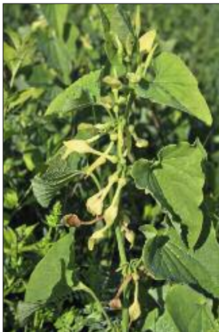
Slika 1. Navadni podraščec ( Aristolochia clematitis ). S semeni te rastline je kontaminirano žito na endemičnih območjih balkanske endemske nefropatije.

in Drine, kar obsega območja Bolgarije, Romunije, Srbije, Bosne in Hercegovine, Kosova ter Hrvaške (slika 2) (4). Prvi primeri nefritisa so bili na več manjših področjih prepoznani v 20. letih prejšnjega stoletja, bolezen pa leta 1956 poimenovana po naselju Vratsa v Bolgariji kot »Vratsa nefritis« (5). Kasneje so ugotovili, da se ista bolezen pojavlja tudi drugod, zato so jo opredelili kot balkansko endemsko nefropatijo (BEN) ali podonavsko družinsko endemsko nefropatijo (angl. Danubian endemic familial nephropathy , DEFN) (4). Vzrok bolezni je dolgo ostal neznan. Glede možne etiologije