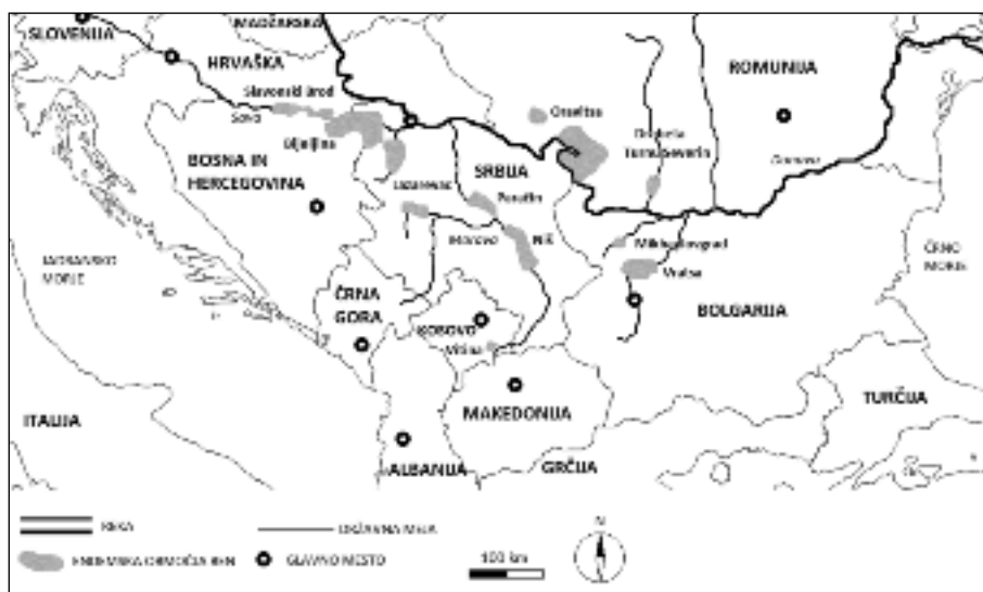
Slika 2. Geografska razširjenost balkanske endemske nefropatije (12, 13).

V predelih Kitajske, Japonske, Tajvana, Irana, Bangladeša, Indije in Maroka zelišča, ki vsebujejo aristolohično kislino, že stoletja uporabljajo v tradicionalni ljudski medicini (1, 14–20). Opisana je uporaba za zdravljenje okužb (zgornjih dihal in sečil, bronhitisa, pljučnice, vaginitisa, ustnih razjed, artritisa, gnojnih ran, okužb s paraziti in hepatitisa), vnetij (protina, revmatizma), bolečine (artralgije, nevralgije, glavobolov), ekcemov, hipertenzije, možgansko-žilnih dogodkov, srčnega popuščanja, edemov, ledvičnih kamnov, kačjih ugrizov, napenjanja, dismenoreje ter za pospešitev poroda in sprožitve splava (1, 2, 21–23). V tradicionalni maroški medicini še vedno uporabljajo vrste rodu Aristolochia (pod ljudskim imenom »bereztem«) pri zdravljenju raka, sladkorne bolezni in motenj v delovanju prebavil (20). V Iranu iste rastline imenujejo »zaravand« ali »chopoghak« in jih uporabljajo pri zdravljenju glavobola, bolečin v hrbtu in anksioznosti (18). V Bangladešu jih uporabljajo za zdravljenje kačjih ugrizov in spolnih motenj (19). Kitajska zelišča, ki vsebujejo aristolohično kislino, sestavljajo deli rastlin iz rodu Aristolochia (Guang