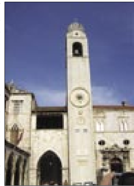
Tören »Bell« s sunčanov vörov

Den svetoga Blaža je 7. februar, šteroga so svetili že inda svejta. Té den so robe dva dni prva iz vauze vöpi-stili, slobaudno so leko ojdli. Če je je niške nej spozno, so leko eške en keden fraj bili.