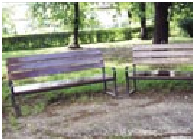
Na tej stolicaj de leko sejdlo starejšo lüstvo pa starši z malimi mlajšami, ka je dala napraviti slovenska samouprava