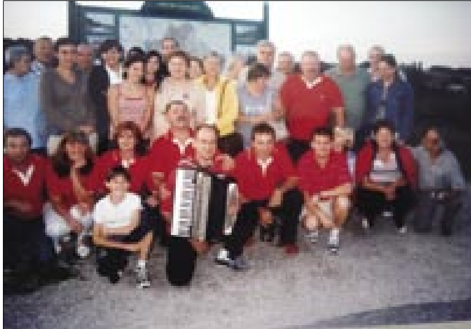
Budimpeštanski Slovinci pa folkloristi z vesi Korena

Po obedi smo se poslovili z dijaškega doma v Radencih, gde smo dve noči spali pa meli djesti. Voditeli so vsi bili vljudni, küjarce so pa sploj dobro küjale. Zadvečerkoma smo v Lendavi poglednili kulturni dom, steroga je načrtovau znani vogrski ar-