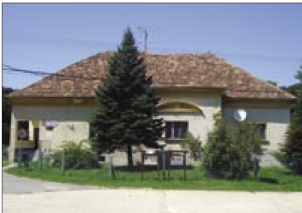
Kulturni dom na Gornjem Seniku čaka na obnovo

»Projekt smo prijavili lani oktobra, to je projekt Sosed sosedu . Vsebuje oz. pokriva celotno Porabje. Prijavili smo se za prioriteto 1-2, to pomeni, da gre za ohranitev in razvoj dediščine v Porabju. Naši partnerji na slovenski strani so Center za zdravje in razvoj Murska sobota in Krajevski prak Goričko. Preden je prišlo do tega, da smo začeli sestavljati projekt, smo povabili vse porabske župane in predsednike pravnih organizacij, da se skupaj zmenimo, za katero prioriteto bi se prijavili in kaj naj bi projekt vseboval. Ker so se takrat občine bolj koncentrirale na kulturno področje, smo se odločili za to prioriteto. Seveda smo poskušali vse več aktivnosti vključiti v projekt. Na madžarski strani ima projekt štiri partnerje, vodilni partner je Razvojna agencija Slovenska krajina, ki bo takorekoč vodila celotno operativno delo za vse madžarske partnerje. Poleg tega je izvedba vsebinskih aktivnosti in organizacija vseh prireditvev tudi naloga agencije. To pomeni, da je v projekt vključen prevod muzejske zbirke v