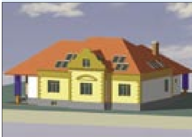
Novi kulturni dom po načrtih