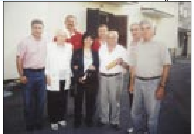
Prejdnji občine Duplek pa našoga društva