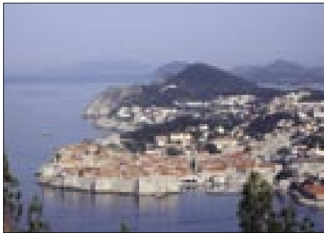
Dubrovnik od vrkaj

Slovange, kisnejši Rovati. V njinom geziki je »dub« bila rejč za drejvo »rast«. O tom, kak sta teva dva varaša