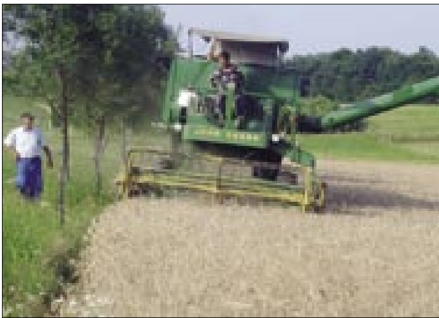
Djauži Sukič ženja, oča, starejši Sukič pa sprvajajo kombajn