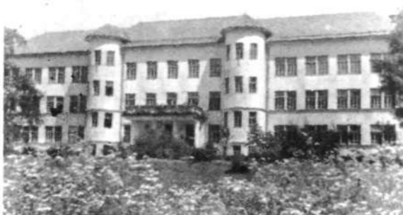
Osnovna šola v Skofji Loki