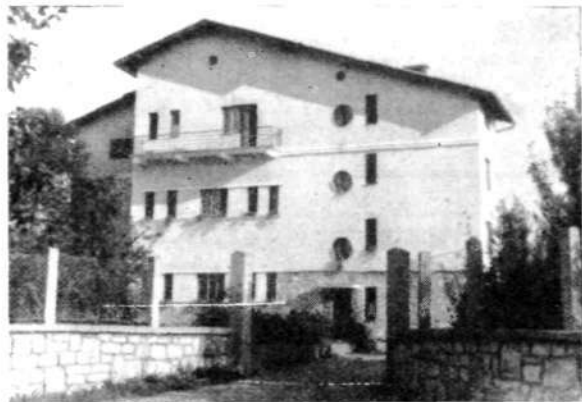
Osnovna šola v Retečah

Na škofjeloško šolo prihajajo delno tudi učenci iz Zabnice, ki imajo svojo matično šolo v Stražišču. Podobno odhaja del učencev iz reteške šole v St. Vid, prav tako pa se stalno večja število učencev, ki prihajajo iz obeh dolin v Škofjo Loko. Točno določene meje med šolskimi okoliši ne bo nikoli mogoče določiti, ker so poleg zemljepisnih razmer še drugi razlogi, ki povzročajo prehode učencev na sosednje šole. Navsezadnje so v ožjem okolišu škofjeloške šole tudi učenci, ki zaradi oddaljenosti ne morejo redno prihajati vsak dan v šolo. To so učenci tako imenovanih gorskih oddelkov iz območja Breznice, Ožbolta in Križne gore.