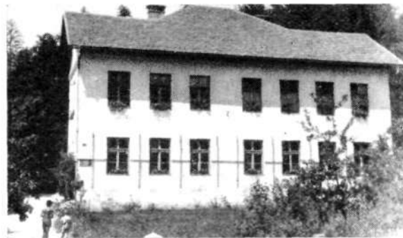
Osnovna šola v Gabrku

Otroški vrtec predvideva novi šolski zakon kot potrebno predšolsko ustanovo. Ugotovljeno je, da se vzgoja in izobrazba ne pričinja v obvezni šoli, ampak so prav predšolska leta najbolj odločilna, kakšen bo človek na svoji življenjski poti. Pri nas je do sedaj prav to vzgojno delo najmanj urejeno in najbolj zanemarjeno. Vedno bolj