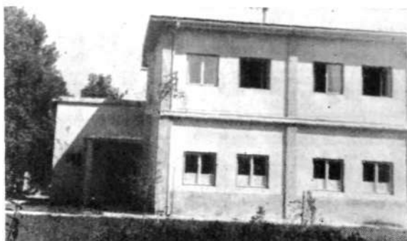
V pridižju stavbe Gorenjske predilnice gostuje osnovna šola na Trati

morejo uspešno končati osemletnega programa, vendar bi podrobne statistike navedle tudi precejšnje število učencev, ki so zastali in shirali na razvitih šolah. Mnogi iz te skupine \frac{1}{4} šoloobveznih otrok niso imeli možnosti, da bi dobivali v svoji šolski dobi izvensolsko pomoč od najetih inštruktorjev in jih je zamorila nižja gimnazija — knjižna šola z zelo zahtevnim programom in z orientacijo proti višji gimnaziji. Bila je še vedno šola, ki naj prebira in izbira med učenci, ki se morajo prilagoditi temu zahtevnemu kurzu, ali pa naj odpadejo. Če številčno podamo sliko te nemogoče zahteve prilagojevanja, vidimo, da je od 32.000 otrok, ki se vsako leto vpišejo v prvi razred osnovne šole, na višji gimnaziji le 1000 maturantov. Za koristi teh 1000 maturantov, ki so pa le manjšina, je bila šolska pot večine 31.000 otrok neposredno ali posredno pod izobrazbenim pritiskom višje gimnazije in je ta večina na tej poti hiralala in izhiralala do \frac{1}{4} .