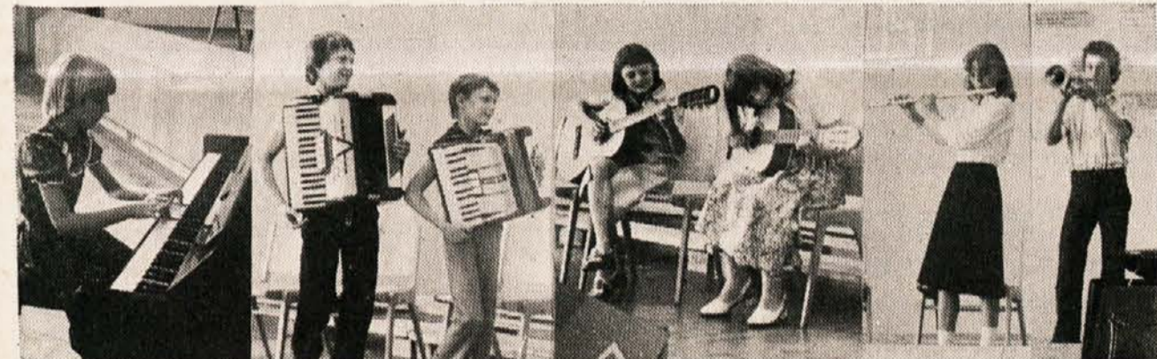
Na vseh teh inštrumentih je mladina na zaključni prireditvi pokazala svoje znanje in razvesolila navzoče starše

in v Svečah, ki jih obiskuje skupno okoli 160 učencev. Glasbeno šolo, ki deluje pod okriljem Slovenske prosvetne zveze in Krščanske kulturne zveze, lahko štejemo med korake samopomoči, ki naj odstranijo pomanjkanje strokovnega znanja na tem važnem področju kulturnega delovanja. Inicijatorji šole so začeli z delom, ker so videli, da država v to smer ne bo povzela nobenih korakov. Že pred enim letom pa so ugotovili, da obstaja pomanjkanje domačih učiteljskih kadrov in da bi po členu 7 državne pogodbe država morala prevzeti stroške glasbene šole. Gle-