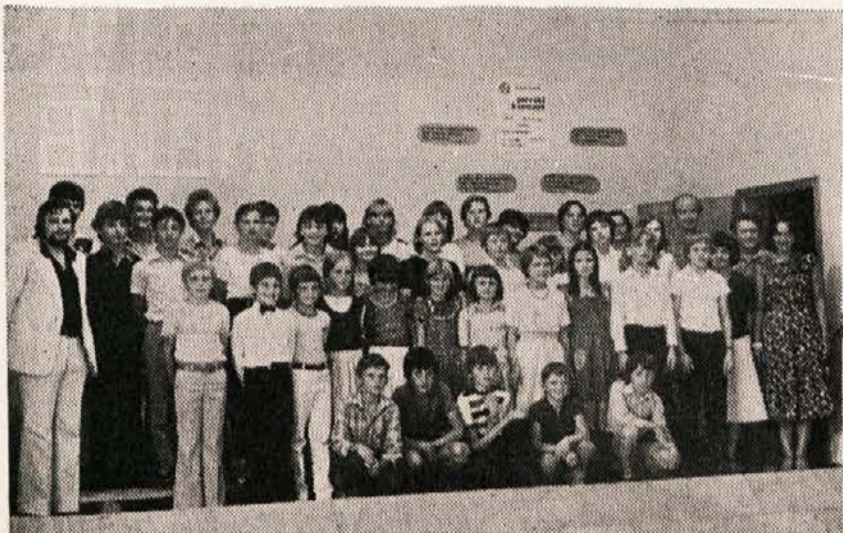
Pliberški učenci s svojimi učitelji

Kdor se hoče prepričati o dosežkih in napredkih naših mladih glasbenikov, ima za to možnost v soboto 7. julija pri Miklavžu v Bilčovsu. Ob 19.30 uri bodo učenci pridreli koncert, v katerem bodo nastopili posamezniki, pa tudi v skupinah.