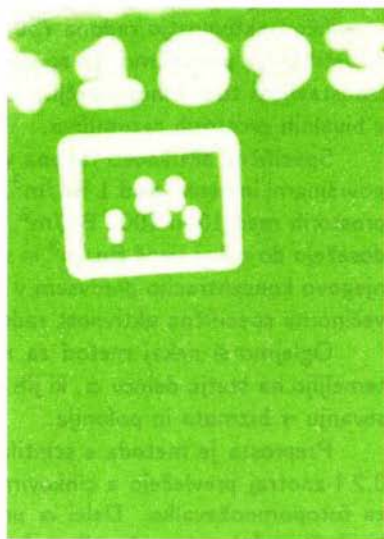
Sledi delcev \alpha po jedkanju v vročem NaOH vidimo kot svetle pike, ko folijo močno osvetlimo s strani. Vsaka folija ima odtisnjeno številko in poseben znak, ki ga prepozna tudi računalnik.

Pri metodi jedrskih sledi uporabimo košček plastične folije. Delci \alpha pustijo v foliji sledi, ki postanejo z jedkanjem v vročem NaOH vidne (slika 2). Štetje značilnih sledi opravijo z računalnikom na osnovi slike, ki jo posreduje televizijska kamera.