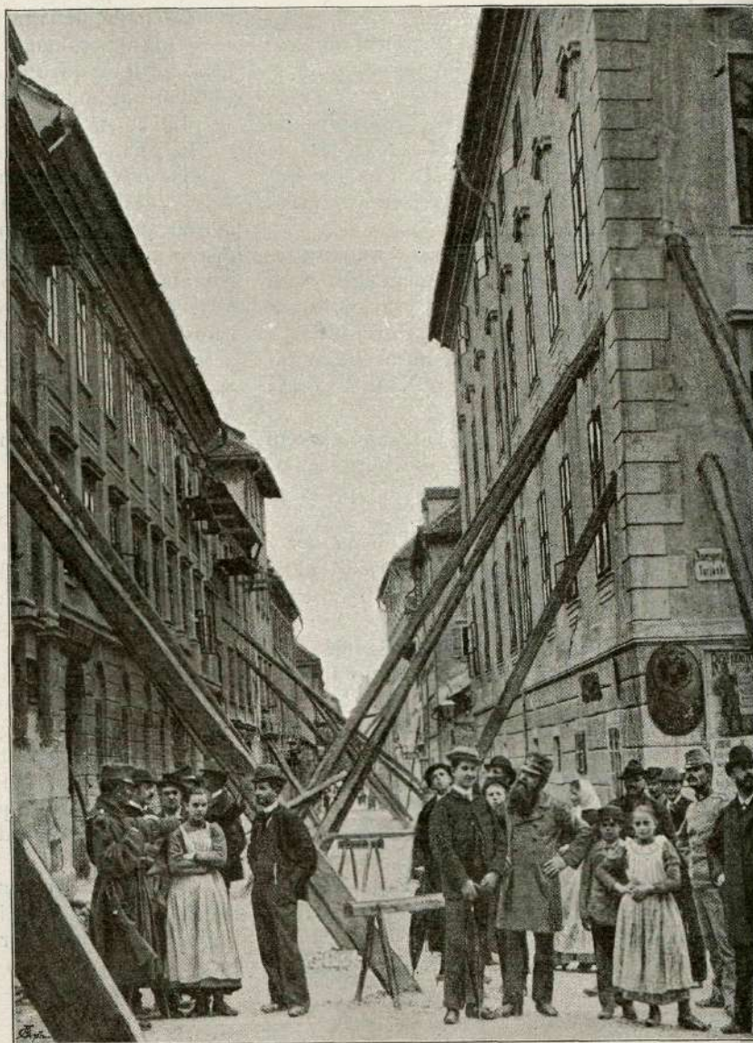
Ljubljana po potresu: Gosposke ulice.

Razpostavljeno dekle je torej ukradlo kako domačo žival.