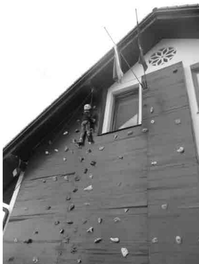
Nekaterim je uspelo do vrha