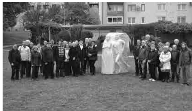
Utrinek s predaje skulpture Zdrav duh v zdravem telesu