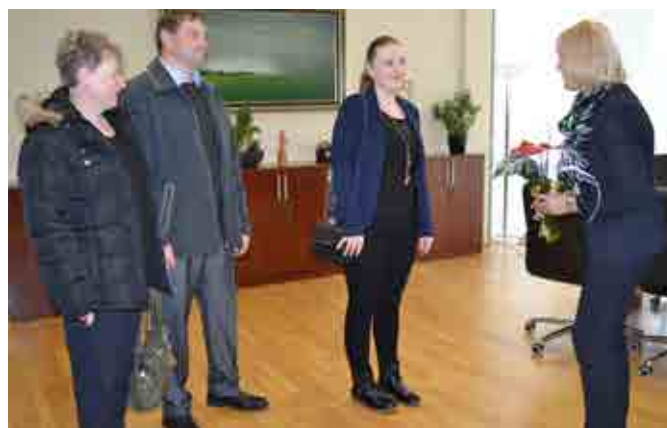
Marina na sprejemu skupaj s staršema