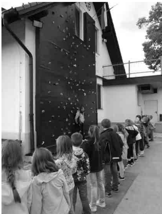
Navodila pred plezanjem