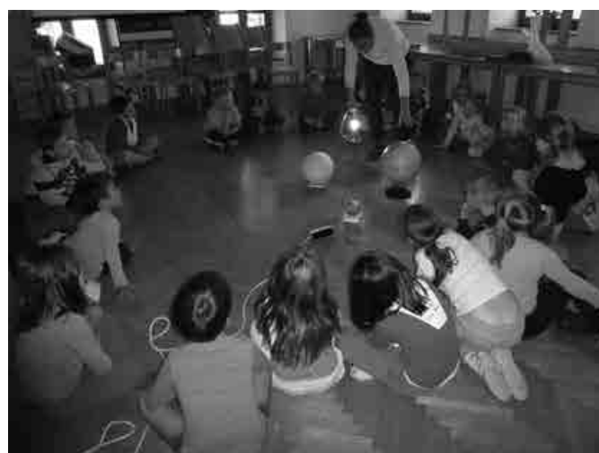
Naučili smo se veliko novega