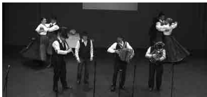
Veseli Prijatelji med nastopom s FS KPD Stoperce

V imenu Veselih prijateljev in v svojem imenu se vam zahvaljujem za množičen obisk med ljudskimi pevci in godci, že sedaj pa vas povabim na šesto srečanje V Majšperku pojemo in igramo po domače 2017. Prepričan sem, da če bomo ohranjali to zvrst ljudskega izročila, se nam zagotovo ni bati za