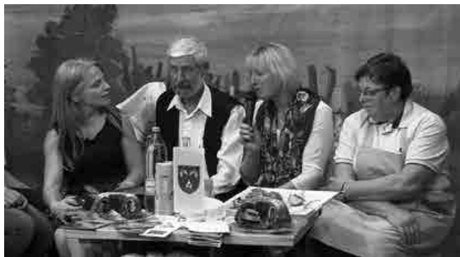
Predstavniki kulture med pogovorom