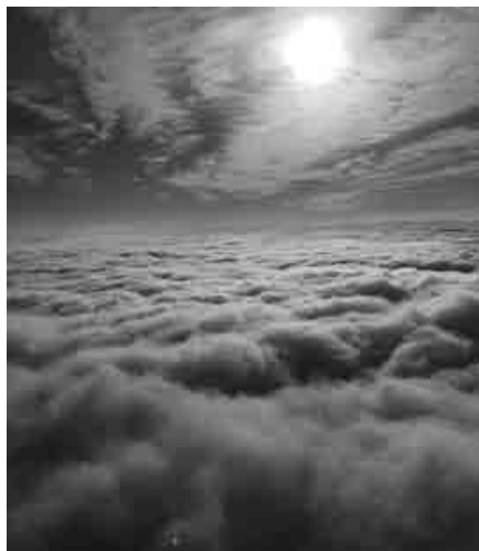
Balonarski pogled nad oblaki