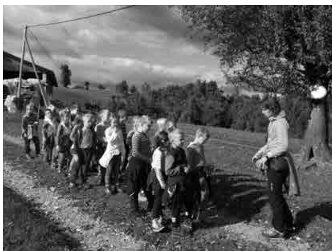
Raziskovali smo okolico