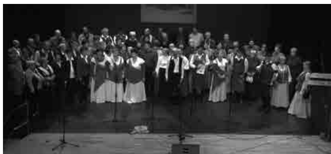
Ob koncu so vsi nastopajoči zapeli »En hribček bom kupil«

V imenu Veselih prijateljev in v svojem imenu se vam zahvaljujem za množičen obisk med ljudskimi pevci in godci, že sedaj pa vas povabim na šesto srečanje V Majšperku pojemo in igramo po domače 2017. Prepričan sem, da če bomo ohranjali to zvrst ljudskega izročila, se nam zagotovo ni bati za