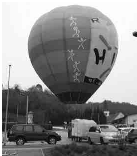
Prvi balon kluba, star 20 let