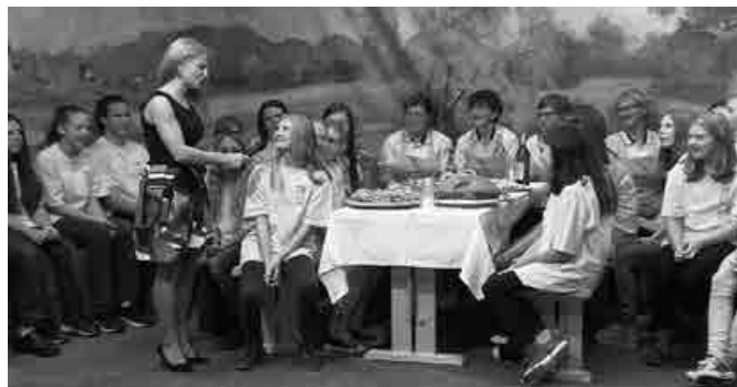
Osnovnošolci in gospodinje iz Majšperka med pogovorom

in drugo dogajanje v vseh treh krajevnih skupnostih ter v občini kot celoti, prav tako pa tudi dogajanje v Halozah. Ob prijetnih zvokih, petju, dobri hrani in kapljici ter prijetnem klepetu nam je čas prehitro minil. S prijetnimi občutki smo se vračali proti Majšperku; ponosni smo, da smo lahko svoje delo in občino Majšperk predstavili v oddaji V nedeljo pod lipo na TV Celje.