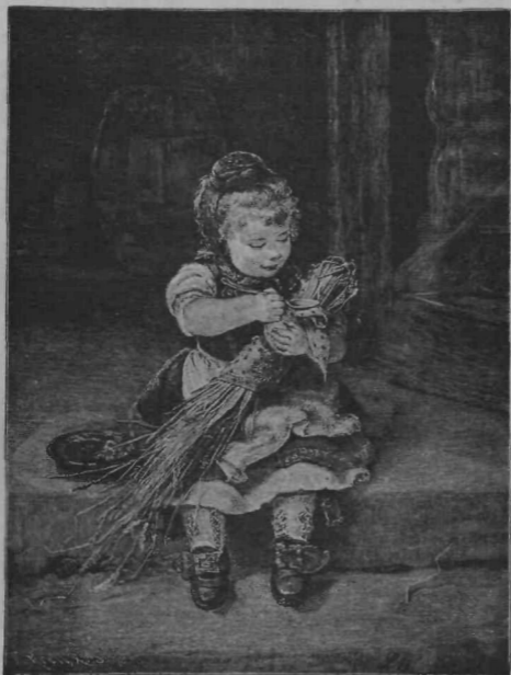
Če punčka joka.