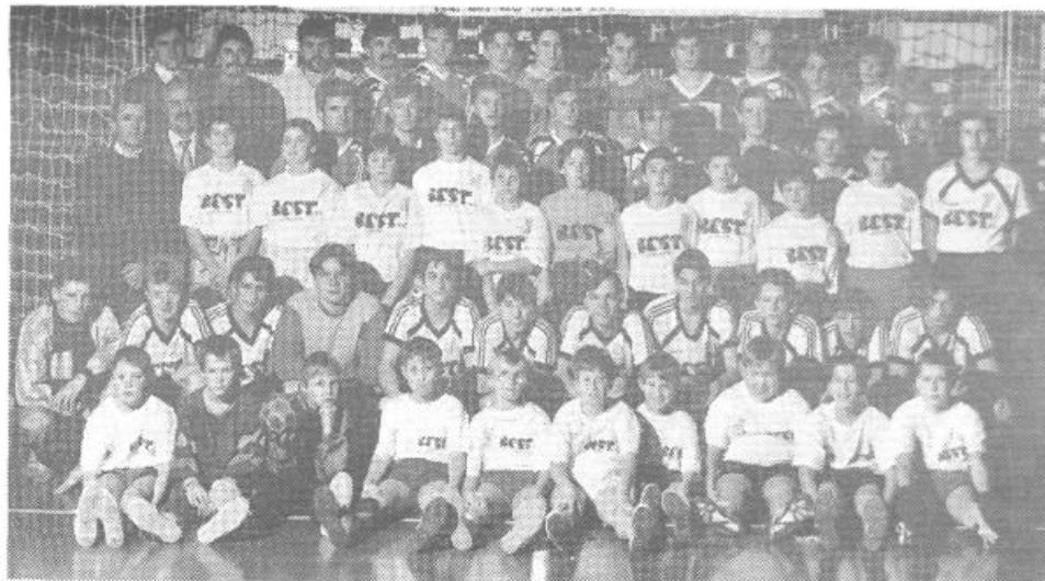
Mlade športnice in športniki Mokercer