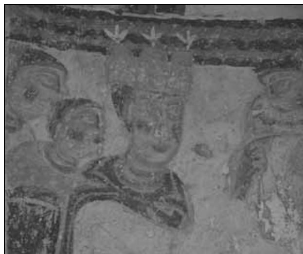
Sl. 3: Detalj zidne slike u Sv. Mihovilu u Kloštru na Limu.

U donjem registru u sredini se nalazi Bogorodica orans okružena sa svake strane petoricom apostola. Broj apostola nas navodi da u sceni Deisis u konhi apside