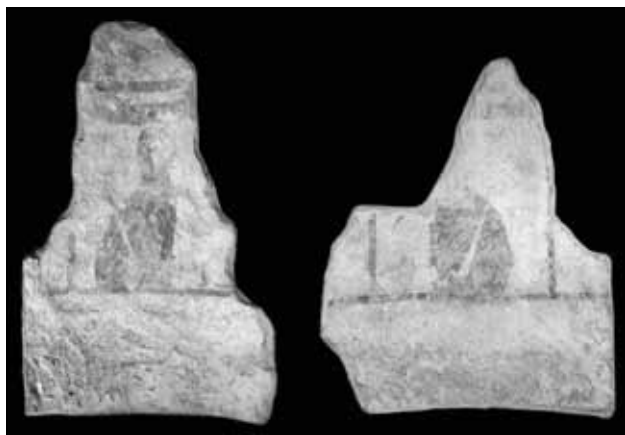
Sl. 1: Ostaci zidnih slika iz Sv. Sofije u Dvigradu.

Slike su skoro monokromne, u tonovima crvenih okera. Dva čitljiva dopojasna lika nalaze se unutar pravilnih, četverokutnih polja izvedenih tankom, crvenom bordurom (sl. 1). Likovi su obučeni u bijele tunike usko pripijene uz tijelo i prekriveni crvenim plaštom kopčanim na ramenu. Jakih su vratova i ovalnih lica. U rukama drže predmete koje je Marušić prepoznao kao bodeže, te je stoga pretpostavio da likovi predstavljaju svece-vojnike. Isti autor spominje da neki oblikovni detalji, kao što su usne, obrve i ruke, podsjećaju na minijaturno slikarstvo 8. i 9. stoljeća. Karakteristični detalj upravo je oblikovanje ruku, tankih, savijenih, šiljasto završenih, bezglobnih prstiju. Crtež je izveden tankim kistom, dugim linijama kaligrafskog poteza što svjedoči o kvaliteti majstora.