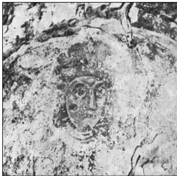
Sl. 7: Nestali fragment zidne slike iz Sv. Marije male kod Bala (fototeka K.O. Rijeka).

"... Bizantinska dionica daje onu ritualnu odmjerenost stavu i kretanjama deizisne Madone, ona traje u samom rječniku ustaljenih morfoloških fraza, koje na svetačkim haljinama rutinski ponavljaju već skamenjene sheme mokrih nabora. Izvjesne bizantinske crte žive i u shemi fizionomija, samo je i ovdje XIII stoljeće premetnulo plastične vrednote u korist grafičkog opisa, izvedenog izvanredno vještom kaligrafijom. Brižno i detaljno majstor se crtački pripremio kad je zelenom zemljom