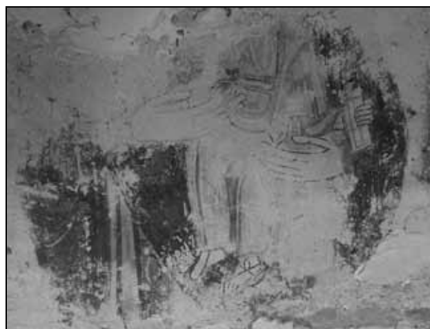
Sl. 6: Detalj zidnih slika u središnjoj apside crkve Sv. Foške kod Batvača blizu Peroja.

U crkvi Sv. Jeronima u Humu Fučić je otkrio zidne slike 1947. godine. Na trijumfalnom luku sačuvano je Navještenje. Na sjevernom zidu očuvan je ciklus iz Kristove muke: Posljednja večera, Judin Poljubac, Raspeće, Skidanje s križa i Polaganje u grob. Slikarije su datirane u drugu polovicu 12. st. Prema ikonografiji majstor se formira u sferi gdje se ukrštaju utjecaji Bizanta i Zapada, Venecija i Akvileja, lagunarno i furlansko tlo u neposrednoj blizini Istre. Relativna čistoća neohelenističkih oblika navodi nas da paralele tražimo u torčelanskim mozaicima i bizantinizirajućim freskama u San Zeno u Veroni. Riječima Branka Fučića gotovo je