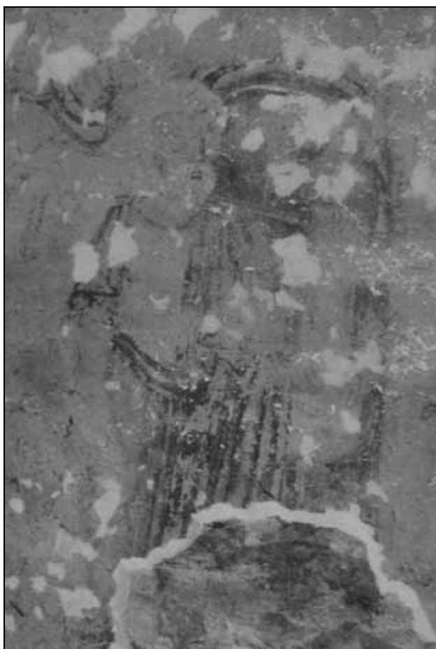
Sl. 5: Ostatak zidnih slika u Sv. Stjepanu u Peroju.

Fig. 5: Remains of wall paintings from St. Stephen's Church in Peroj.