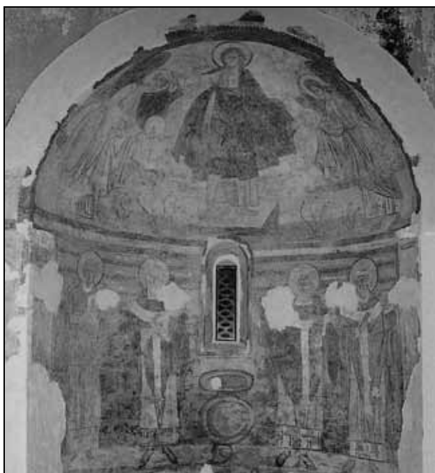
Sl. 2: Zidne slike iz južne apside župne crkve Sv. Martina u Sv. Lovreču.

Fig. 2: Wall paintings from the southern apse of the parish church of St. Martin's in Sv. Lovreč.