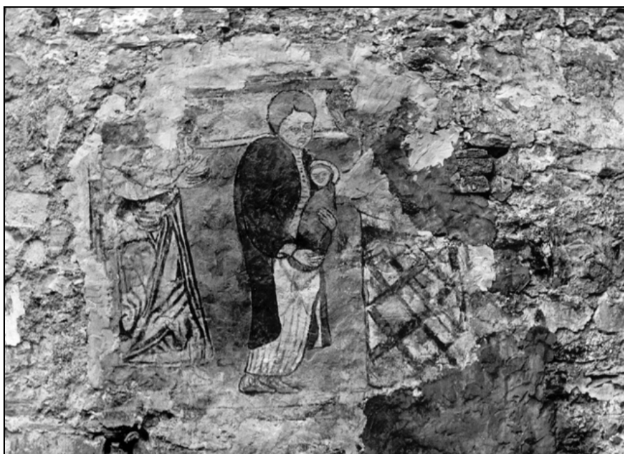
Sl. 8: Nestali fragment zidne slike iz Sv. Kuzme i Damjana u Boljunu (fototeka K.O. Rijeka).

Od ovih lokaliteta nedavno su konzervirani ostaci zidnih slika u crkvi Sv. Marije od Sniga u Maružinama (sl. 9). Fučiću je bio poznat samo fragment lica svetice unutar apsida. (Fučić, 1964). Na osnovu njega napisao je prekrasne stranice ikonografske analize navedenog fragmenta, na osnovu čega slikariju datira u 12. ili najranije početak 13. st. Osim ovog ulomka sačuvani su ostaci likova u bijeloj haljini ogrnutih crvenim plaštom. Likovi okrenuti prema svetištu dio su scene Deisisa. Pod desnom trompom nalazi se fragmenat aureole još jednog svetačkog lika. Ovi podaci nam govore o tome kako u donjem registru unutar apsida nije bio prikazan uobi-