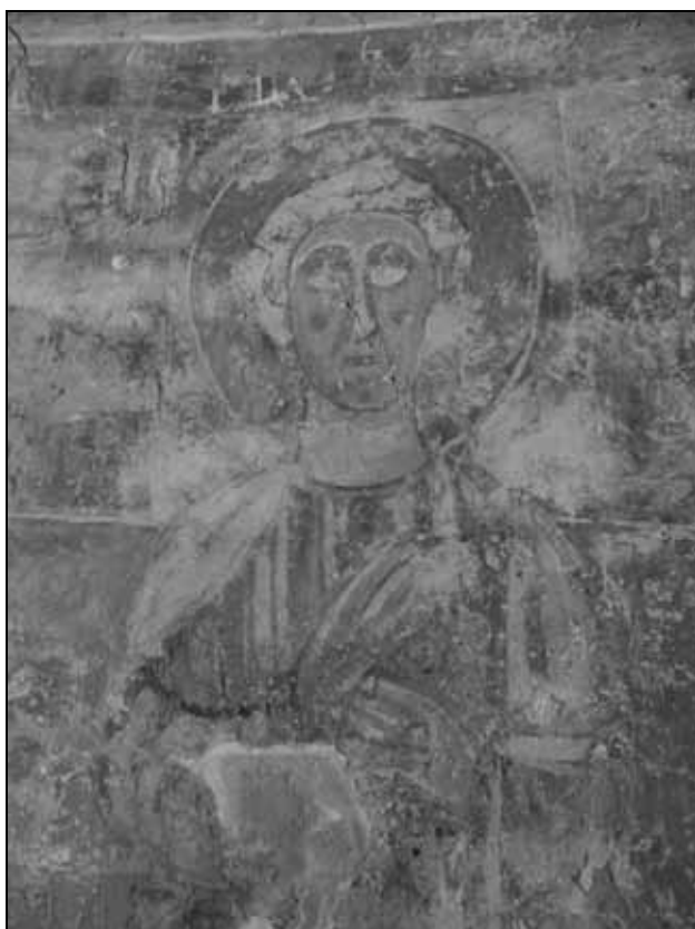
Sl. 4: Detalj zidnih slika u crkvi Sv. Agate kod Kanfanara za vrijeme restauracije.