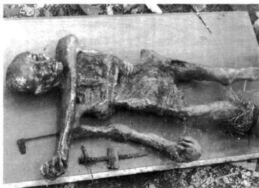
Kamenodobni ali bronastodobni človek iz Similauna, kot ga je ohranil ledenik

Kaj je počel Ötzi v visoki gorski divjini, kamor danes prihajajo le zagnani in izkušeni planinci? Po vseh razpravah, konferencah, simpozijih in ekspertizah je še najbolj obveljalo mnenje, da je bil mož, ki se ga je prijel ime Ötzi, najbrž pastir. Tudi še zdaj prihajajo v te kraje že na pomlad pastirji, ki zenejo svoje tisočglave