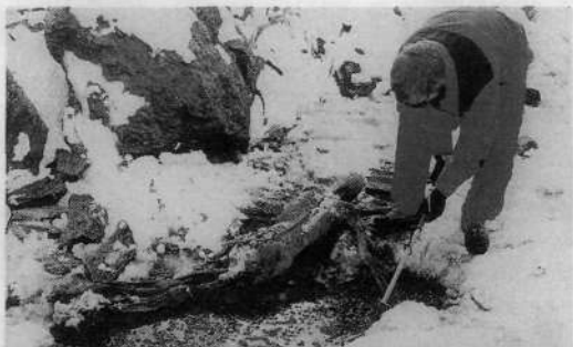
Led in sneg sta se jeseni leta 1991 nenadoma naglo stopila in odkrila ponesrečenca spred 5300 let – zdaj že legendarnega Ōtzi.

tembra (0043/525-48-130). Potem naskoĉijo preval Niederjoch in se spotoma po robih izognejo ledeniku; smer je oznaĉena s kamni. Na prevalu je Similaunska koĉa (3019 m), ki je odprta od konca junija do konca septembra (0473/669-711).