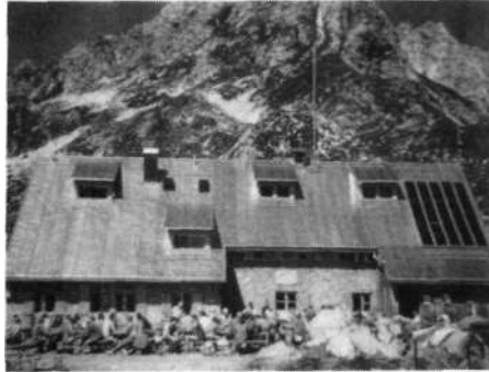
Sončni kolektorji na Mindelheimerski koči

Planinske postojanke so porabniki energije. Stopnja vpliva na okolje je odvisna od načina pridobivanja energije. Ker priključek na javno omrežje ni vedno mogoč, predvsem v višjih legah, so postojanke večinoma vezane na lastne vire. Med temi prevladujejo dieselski in bencinski agregati, ki so dejanska in potencialna obremenitev za okolje. Pretiranemu hrupu se sicer lahko izognemo s pravilno protihrupno zaščito, težja pa je zaščita pred onesnaženjem okolja z gorivom in olji, tako med obratovanjem kot skladiščenjem. Upoštevati moramo tudi, da uporaba fosilnih goriv vse bolj prispeva tudi k nezaželenemu učinku tople grede.