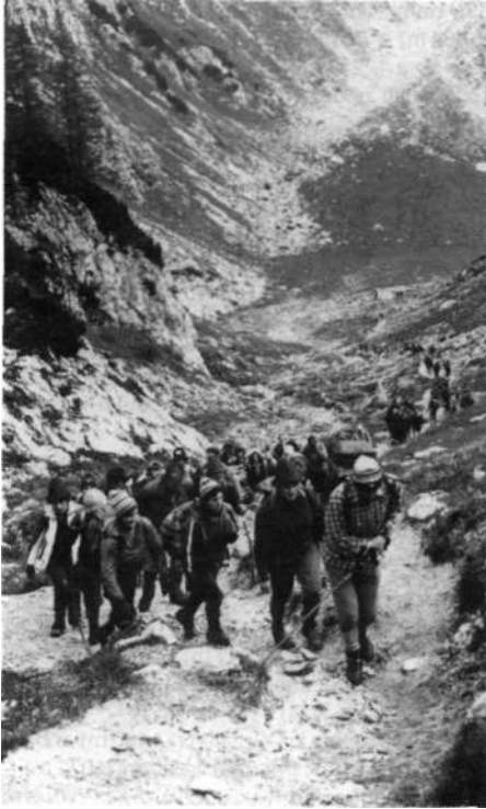
Zdaj že pred odhodom v gore natančno vemo, kakšne težave lahko pričakujemo na poti