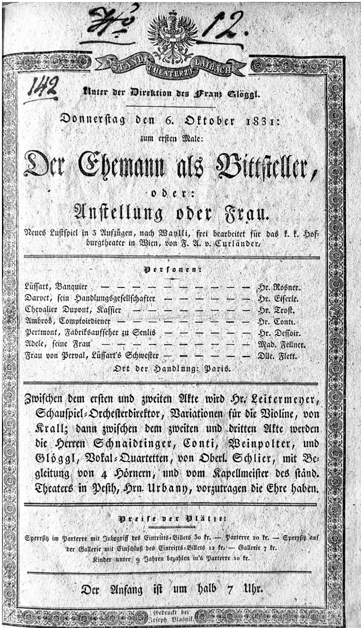
Figure 3: Performance by Joseph Leitermeyer during an intermission in 1831. 67