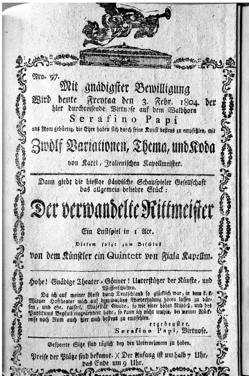
Figure 4: Performance by the virtuoso Serafino Papi in 1804. 80