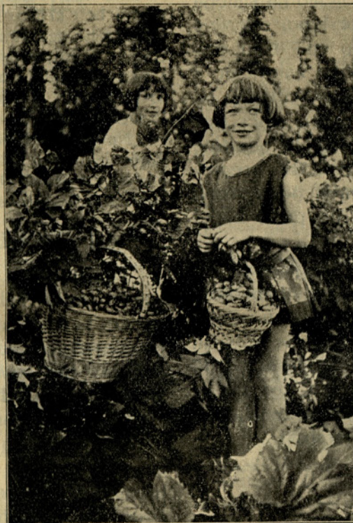
»Letos bo hmeljska letina menda precej obilna in izbira najboljšega blaga med najboljšim še večja kakor lani. Zato pa moramo tudi obirati še bolj skrbno: v veliko košaro nabiram le res čisto gladko-zelene, pravilno jajčaste in dozorele kobule, v malo pa le nekoliko hibne, dočim preveč lisastih, nemarnih, medlih in kvarnih letos sploh ne obiramo, ker bi se ne izplačalo.«

Zelo važno pri sušenju je, da pride hmelj iz sušilnice res suh, ne pa samo na videz suh ali pa že sežgan. Tudi to je skrb sušača, ki že mora imeti toliko vaje, da zna natančno določiti, kdaj je