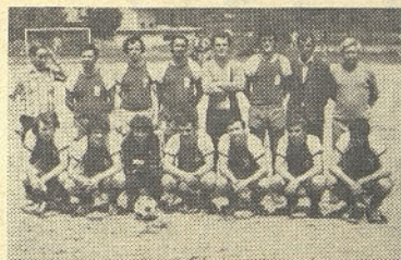
Nogometašem je za las ušlo prvo mesto