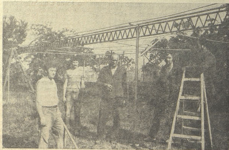
Ekipa naših profesionistov urejuje parkirni prostor v Portorožu

Prav v času mojega bivanja v Portorožu se je nahajala tam tudi ekipa naših sodelavcev (profesionistov), ki so urejevali parkirišče in izvršili tudi druga večja popravila v jedilnici in drugih ob-