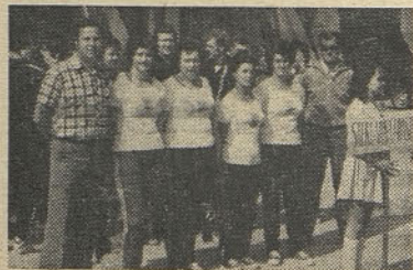
Del naše ekipe pred otvoritveno slovesnostjo. V ospredju ekipa kegljavk

Posamezno: 1. Sele (Donit) 431, 2. Mustać (Steklarna) 417, 3. Končan (Donit) 400, 8. Pokrajac (Steklarna) 357, 12. Janežič 343, 14. Godicelj 437 podrtih kegljev. Skupno je nastopilo 19 kegljavk.