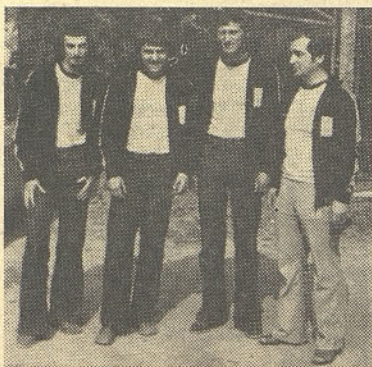
Pinkponkaši, samo en set in njihovo bi bilo drugo mesto

Vrnimo se k rezultatom. Med tistimi našimi ekipami, ki zaslužijo vso pohvalo, so nedvomno v prvi vrsti strelci, pa šahisti in nogometaši. Če smo ponovno osvoboditev prvega mesta naših strelcev pričakovali, pa so toliko bolj razveselili šahisti. Z osvojenim drugim mestom so dosegli svojo najboljšo uvrstitev, odkar nastopajo na peteroboju. Nogometaši so naša najnesrečnejša ekipa. Tudi takrat, ko imajo prvo mesto praktično že v rokah, se jim le-to izmuzne v zadnjem hipu. Kegljari so dosegli »svojo« uvrstitev. Za marsikoga je tretje mesto mogo-