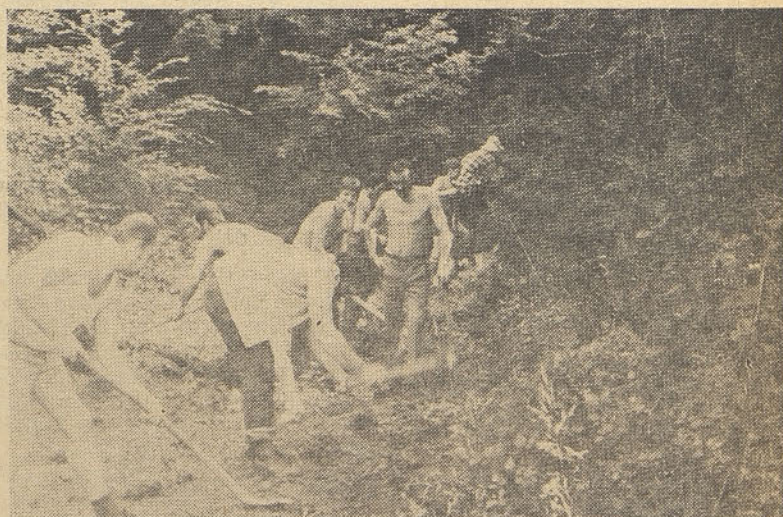
Uđarniško delo delavcev TOZD 4 v Gorah

Zalujoči: bratje in sestre z družinami ter ostalo sorodstvo