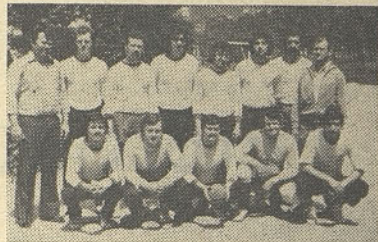
Rokometaši so igrali bolje, kot pa to kažejo rezultati