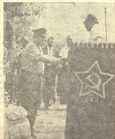
Predstavniki ZZB NOV sprejema občinsko priznanje

Po sklepu delegatov vseh treh zborov Skupščine občine Hrastnik je bilo priznanje izročeno dne 4. julija, ob odkritju spomenika padlim v NOB v Krnicah.