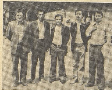
Šahisti so presenetili vse. Tudi sami sebe