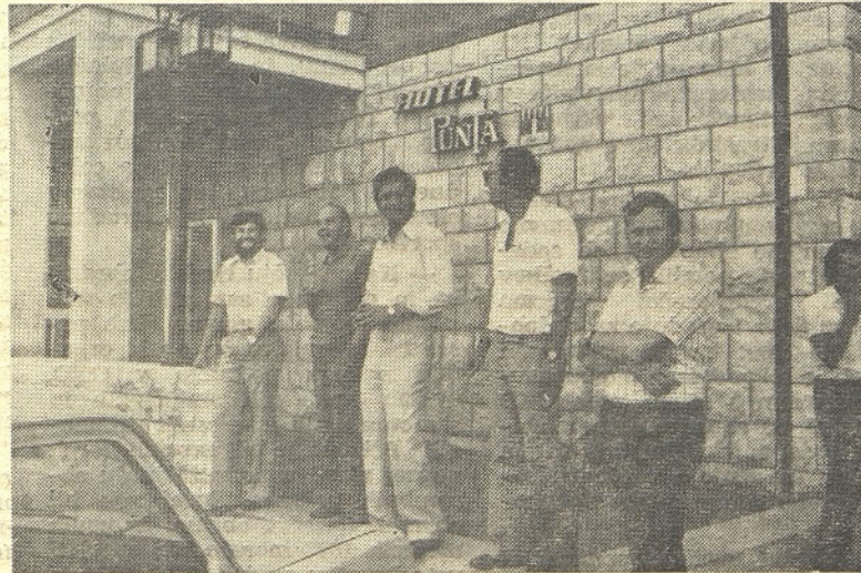
V Piranu je bil tridnevni seminar o obveščanju delavcev v združenem delu