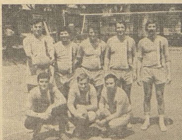
Ekipa naših odbojkarjev, tokrat boljša kot prejšnja leta