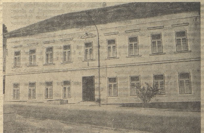
Prenovljeni hrastniški muzej