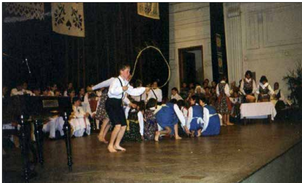
Nastop na državnem srečanju otroških folklornih skupin, Maribor 1998.