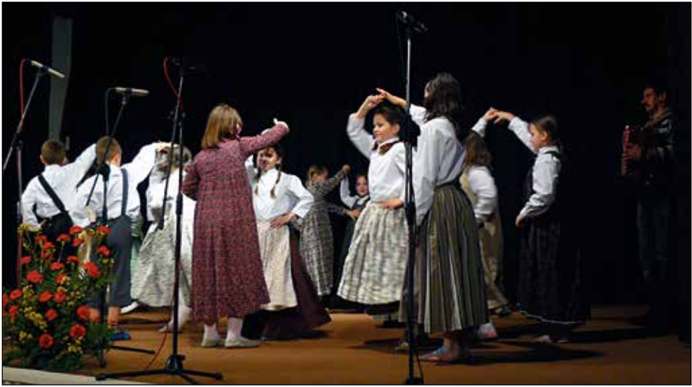
Nastop na krajevni prireditvi, april 2009.