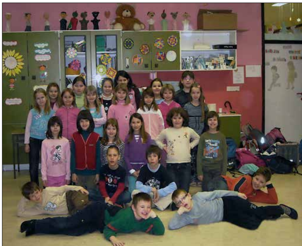
Starejša folklorna skupina v šolskem letu 2008/09: smo zelo pisana družčina ...