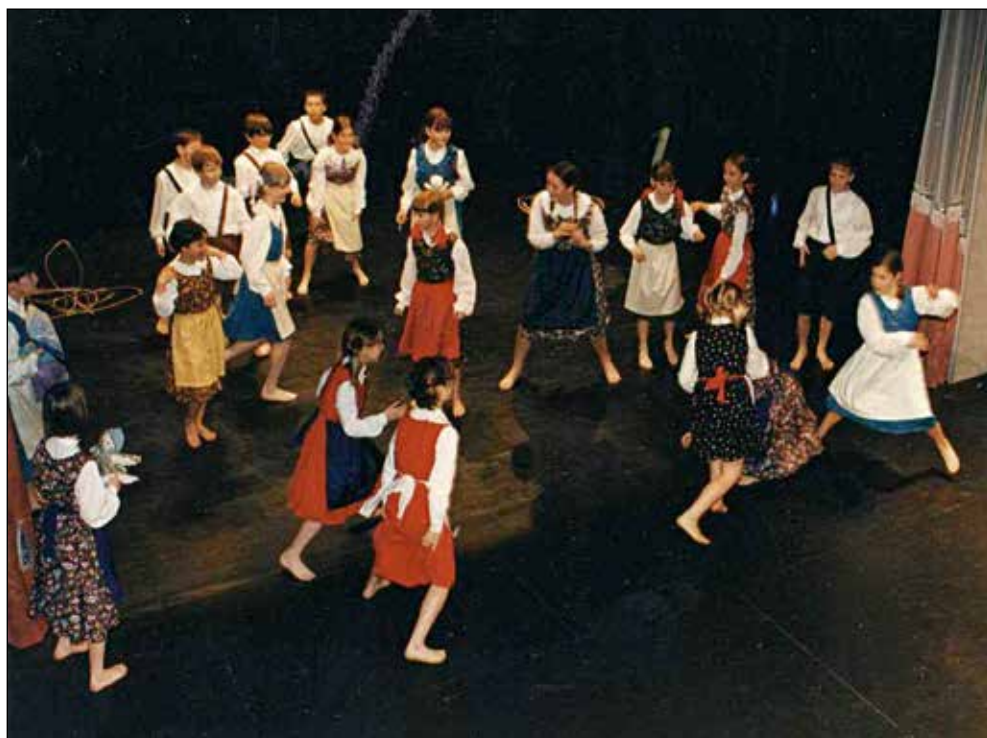
Nastop na državnem srečanju otroških folklornih skupin, Maribor 1998.