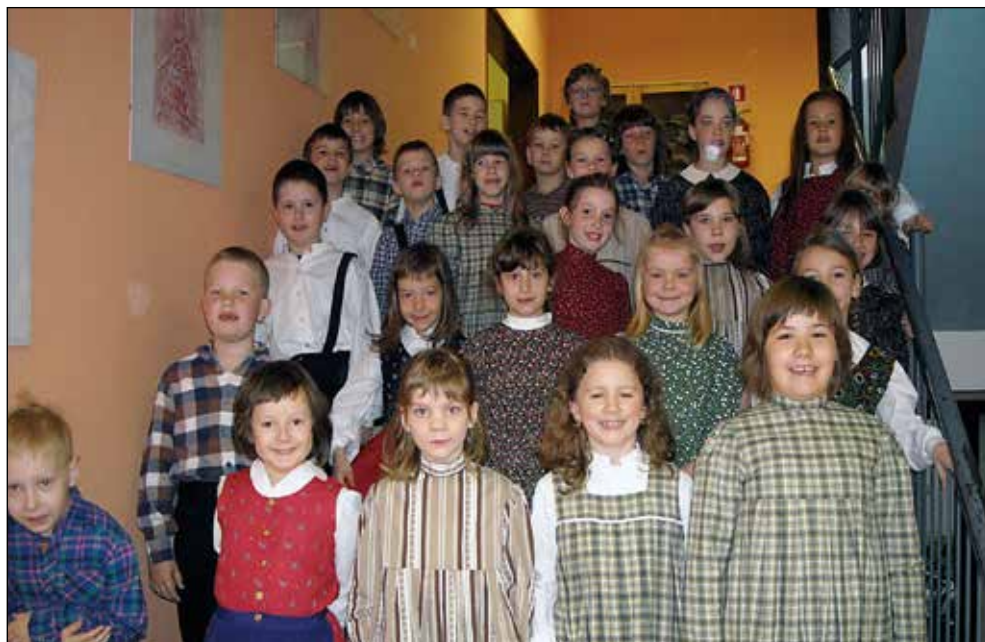
Mlajša folklorna skupina v šolskem letu 2008/09.