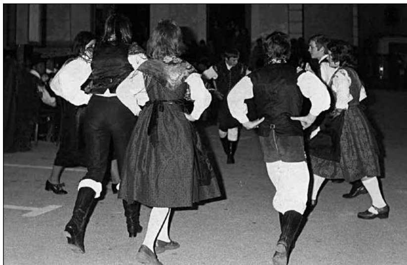
Nastop prvih plesalcev pred cerkvijo na Trnju.

In kakšni so bili prvi začetki? "Z učenci 4. razredov smo hoteli popestriti šolsko proslavo tudi s