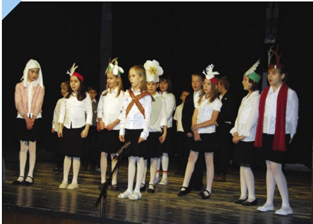
Učenci osnovne šole Monošter so bili zelo ljubki