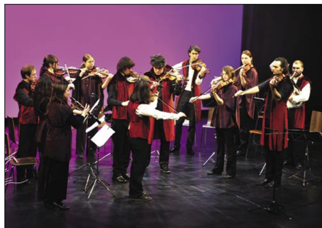
Nastop Simboličnega orkestra

Kljub kar velikim zapletom, ki so se vrstili v Mariboru drug za drugim, se je tudi na zunaj, zlasti pa v prireditvenih prostorih, močno spremenila podoba mesta ob Dravi. Pomenljivo podobo dajejo Mariboru tudi svetlobni napisi – naslovi književnih del Draga Jančarja, enega najbolj prevajanih in v svetu uveljavljenih slovenskih pisateljev: Galjot