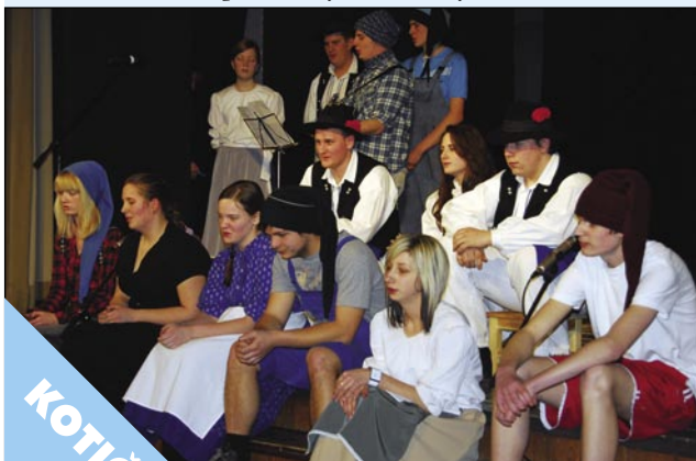
Skupna pesem dijakov