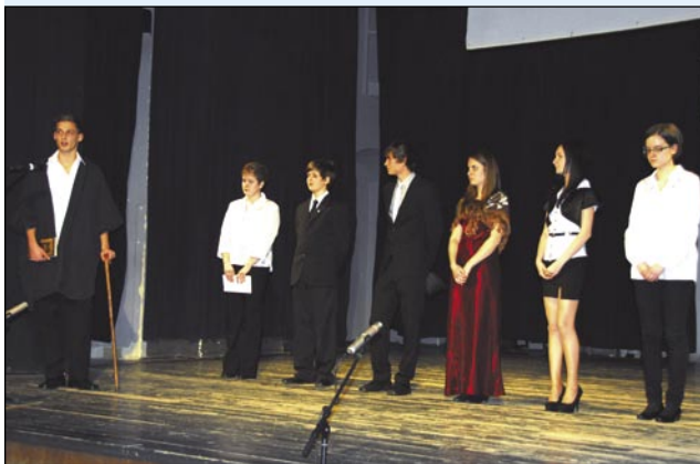
Dijaki gimnazije so predstavili življenje Franceta Prešerna