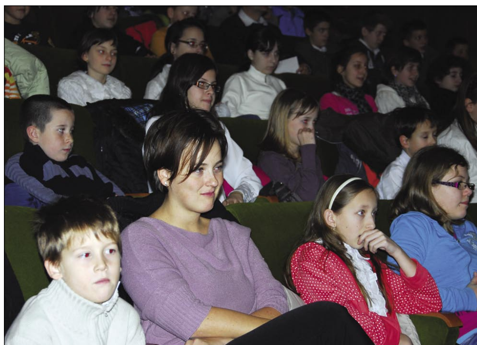
Državna slovenska samouprava je na praznik slovenske kulture povabila vse učence in dijake porabskih šol

da je slovenščina eden od uradnih jezikov Evropske unije, lep jezik, ki je tudi po umetniški vrednosti enak drugim jezikom.