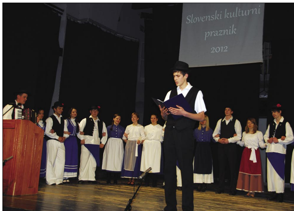
Letošnji program ob dnevu slovenske kulture so pripravili monoštrski učenci in dijaki