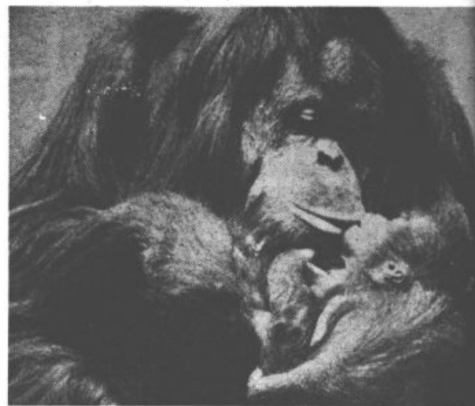
Orangutanova samica z mladičem

Stonoga se je s svojimi predniki pojavila na zemlji že pred 300 milijoni let. S svojimi petnajstimi pari nog tiplje in se premika. Ko ulovi plen, ga z nogami otiplje in ugotovi njegovo prehrabeno vrednost. Pri tem je važno, da so njene noge vedno čiste in dovolj gibčne, zato jih čisti vsakih 10 minut. In kaj se zgodi, če je stonoga