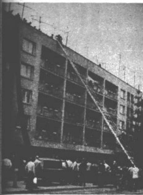
Na vaji so uporabili tudi avtolestev