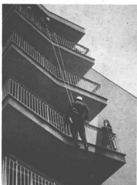
Na vaji so pokazali, da so dobro usposobljeni