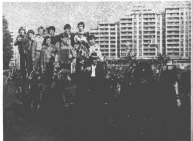
Na okrašenem vozov so se pripeljali tudi fantje iz Škal

Fantje so prihajali na nabor z velikim veseljem, po Velenju pa je odmevala njihova pesem. Iz vsake krajevne skupnosti so se pripeljali s svojim vozom.