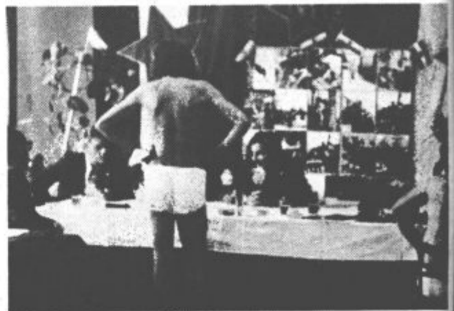
Služili bodo domovini