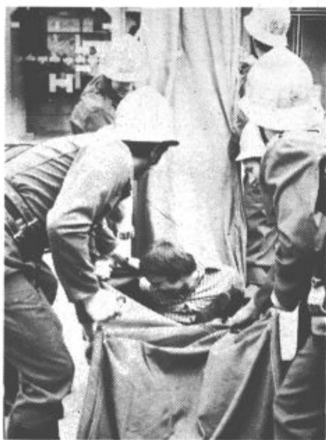
Brez reševalnih prtov bi bilo bolj težko