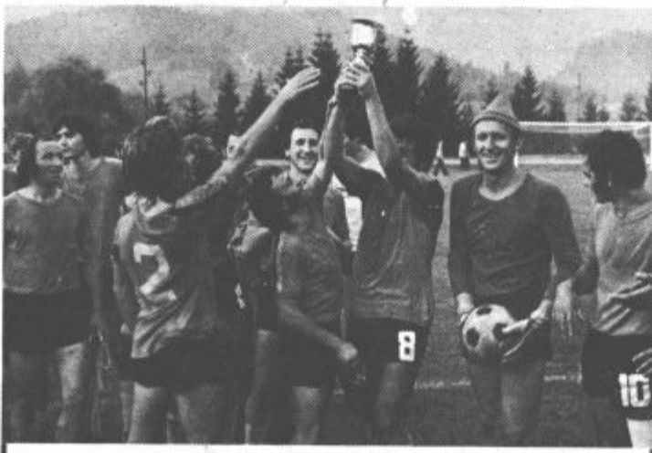
Vesetje po zmagi nad igralci iz Šmartnega je bilo nepopisno.

DELAVSKA UNIVERZA VELENJE bo v izobraževalni sezoni 1975/76 organizirala poleg drugih izobraževalnih oblik tudi naslednje: TEČAJE TUJIH JEZIKOV - Nemščina - avdiovizualna metoda - začetni in nadaljevalni tečaj - Angleščina - asimil metoda - začetni in nadaljevalni tečaj - Italijanščina - direktna metoda - začetni tečaj - Francoščina - direktna metoda - začetni tečaj