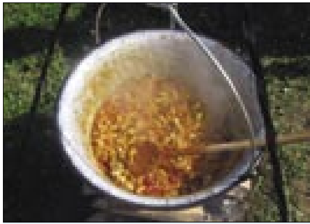
Sataras (lecsó), ki si je zaslužil drugo mesto

srečanja zaradi drugih obveznosti ni mogel udeležiti. »Naj naprej pozdravim vas, vse zbrane in takoj zatem tudi idejo, ki vas je danes tu združila. Že peto tradicionalno srečanje z zamejskimi Slovenci dokazuje, kako pomembno in dragoceno vlogo združevanja in povezovanja imajo srečanja, kot je današnje. Četudi me