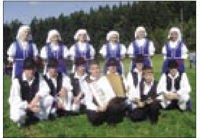
Folklorna skupina ZS Gornji Senik

V lečo smo dali poleg običajnih sestavin še slanino in tudi šampinjone, na koncu pa smo še primešali jajce. Moram povedati, da nam je zelo dobro uspelo, okus je bil enkraten. Tako so nam povedali obiskovalci in ostali tekmovalci, ki so se že kar na začetku spogledovali z našim lečojem, vsi so ga hoteli poskusiti. Ko je bila hrana pripravljena, je stala kar dolga vrsta pri našem kotličku. Na koncu nam je ostalo