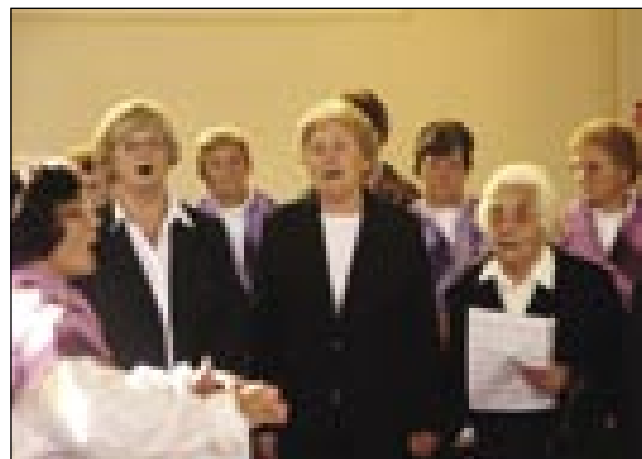
Cerkvene pevke in pevke DU iz Vuhreda v gorenjeseniški cerkvi

stera je povezovala program, na kratki tapovedala živle-