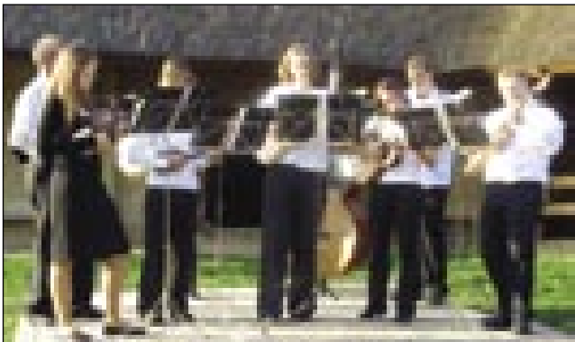
Dunajski slovenski tamburaški ansambel Fermata

sv. Martinu in goseh, med katere se je skrtil, ko ni hotel biti škof. V tistem času