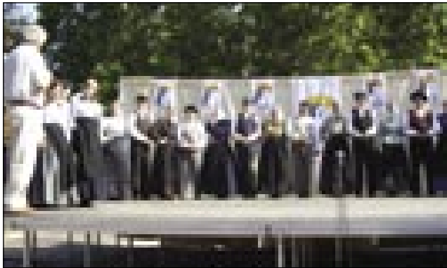
Moščanska folklor v Budimpešti

Dnevi letijo eden za drugim, minaulo je eno leto, pá je prišod den festivala. Letos so se manjšine, stere delajo v 18. okrožji Budimpešte, srečale na te den. Prvin smo manjšine ejkstra držale srečanja, pa tisto je bilo za nas pravo. Zdaj že eno par lejt, ka so se manjšinske samouprave tak odlaučile, ka gda so Dnevi Havanna (tau je menje blokovske četrti v 18. okrožji), te naj bauda festival manjšin tō. Ta prireditev drži eden keden. Prvin