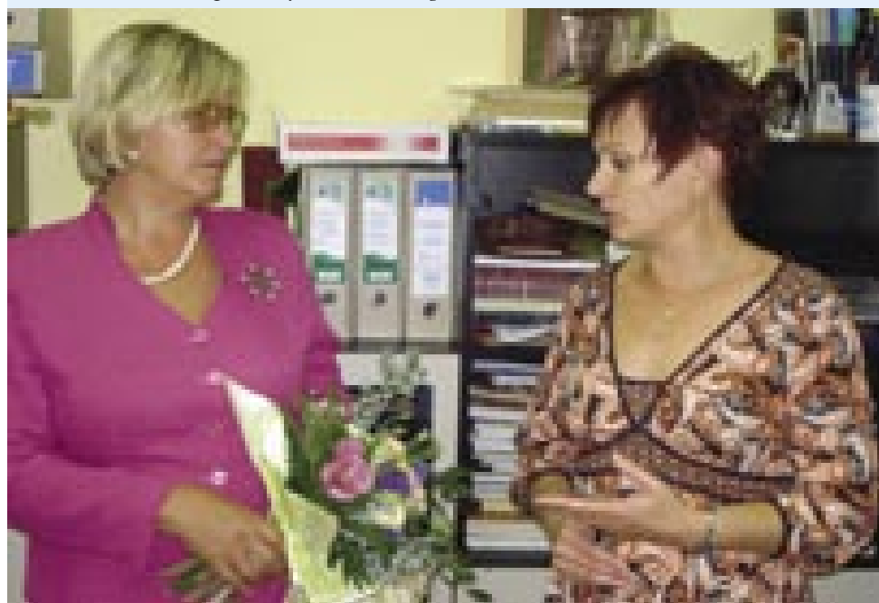
Na obisku v uredništvu tednika Porabje