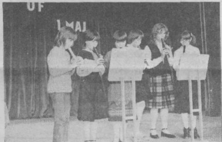
Ansambel blok flavic se je predstavil na slavnostni seji DPO

Proslava 10. obletnice Glasbene šole je bila v petek, 18. maja 1984 ob 20. uri v kulturnem domu. Slavnostni govornik je bil Edo Gale, predsednik skupščine Občinske izobraževalne skupnosti.