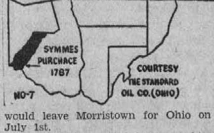
SYMMES PURCHASE 1787

would leave Morristown for Ohio on July 1st.