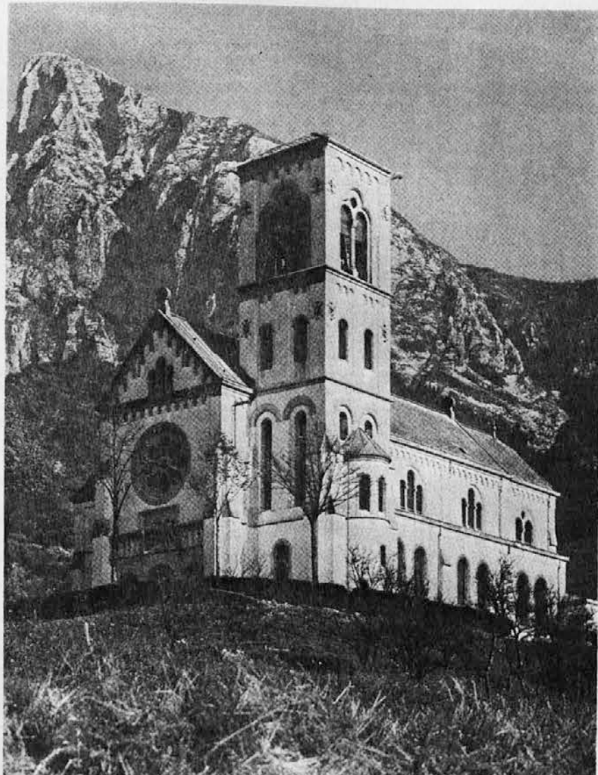
Božjepotna cerkev Srca Jezusovega v Drežnici pod Krnom