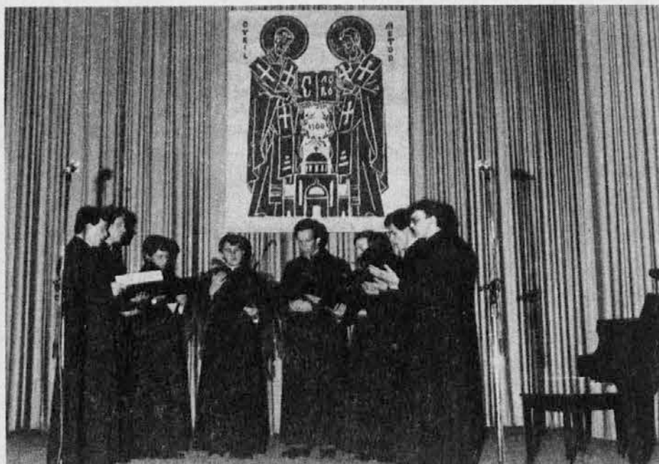
Ekumenski oktet ljubljanskih bogoslovcev, ki je nastopil na proslavi sv. Metoda v nedeljo 3. marca v Katoliškem domu v Gorici