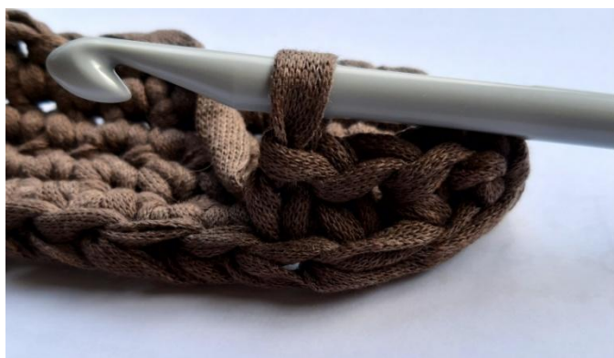
Slika Pravilno narejeno