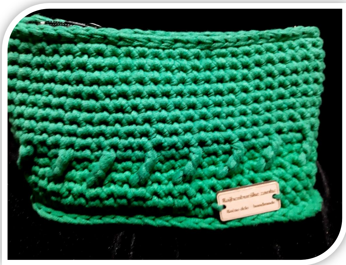
Slika: Toaletna torbica