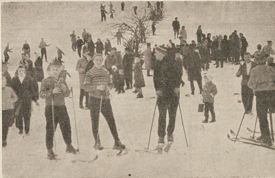
Na smučarskem tekmovanju v Loškem potoku 11. februarja

Prireditve je v celoti dobro uspela in je dala tekmovalcem veliko vzpodbude za razvijanje zimskega športa v Dobrepoljski dolini.