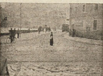
Pionirji — prometniki pri usmerjanju prometa na križišču pri spomeniku v Kočevju

kov pionirk, katerih v prvem krožku sploh ni bilo. Tovariš Poje je poudaril, da so pionirke v učenju zelo marljive in prizadevne. Izpite bodo kandidatje polagali v sredini meseca marca. Tudi pionirke bodo praktično usmerjale promet na cesti, saj to slehernega pionirja prometnika najbolj veseli. Želimo jim veliko uspeha v krožku, na izpitu in pri usmerjanju prometa na cesti.