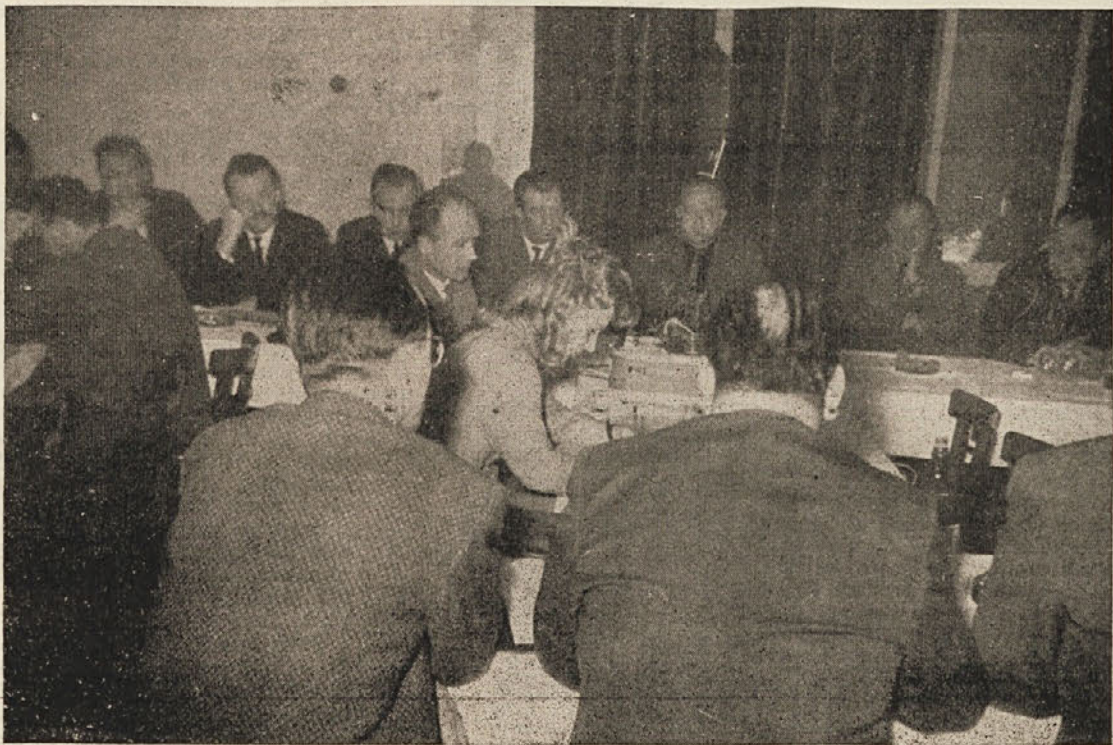
Na seji Izvršilnega odbora Zvezne prometne zbornice, sekcije za LRS v hotelu Pugled — Kočevje

Da bi vsaj delno zmanjšali vrzel v proračunu, je občinski ljudski odbor predvidel nove datjave: dopolnilni proračunski (Nadaljevanje na 2. strani)