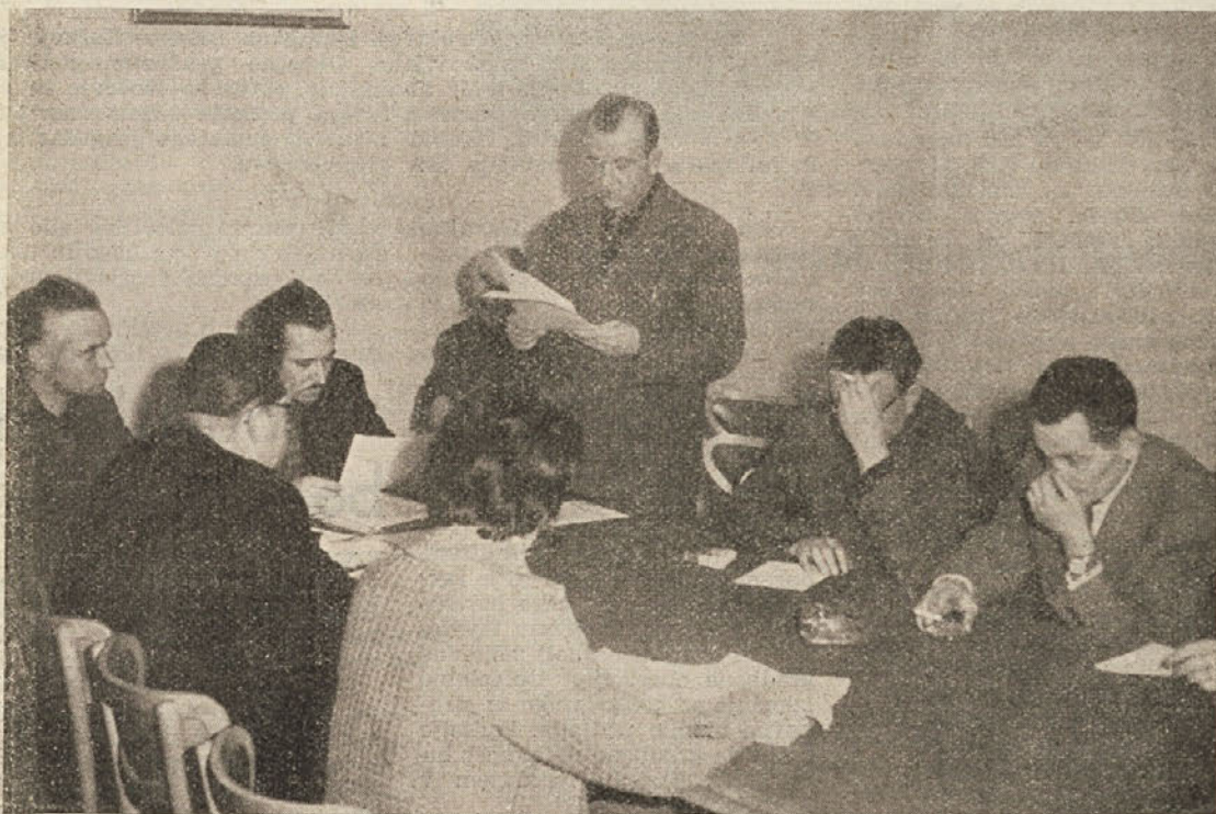
Streli poslušajo poročilo predsednika obč. strelskega odbora (glej članek na 2. strani)

Pri gospodarskih investicijah bo iz občinskega investicijskega sklada zagotovljeno samo posojilo za Kemično tovarno, ki ima vse pogoje (zaradi prejetih posojil iz skladov republike), da bo začela obratovati že letos. Ostale gradnje bodo šle iz skladov podjetij, lahko pa tudi iz skladov okraja, republike ali zveze. O problemih občinskega proračuna in še posebej sklada za finansiranje šolstva kakor tudi o negospodarskih in gospodarskih investicijah že razpravljajo kolektivi in zbori volivcev. Sklepe bodo posredovali občinskemu ljudskemu odboru, ki bo na njihovi podlagi izdelal ustrezne odloke.