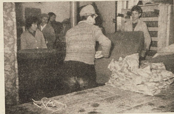
V tapetniški delavnici Opreme

»Uh, si pa natančen,« ga je zavrnila. »Saj sem hotela povedati, da samo ženske,« je spet menila tovarišica. Dalje nam je povedala, da je v organizaciji LMS, na sestanke pa ne hodi. Doma se ji zdi lepše kot v Kočevju, sicer je pa kar zadovoljna.