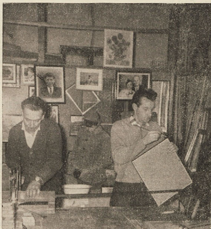
Obrat Steklarstvo v Kočevju

Gostinski obrati še vedno ne zadovoljujejo turistov in res je že skrajni čas za gradnjo hotela, ali vsaj sodobne restavracije. Kako je mogoče vabiti turiste,