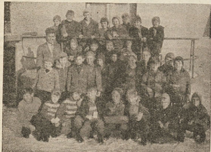
Pionirji — prometniki po opravljenem izpitu

V mesecu februarju se krožek o prometu na šoli nadaljuje. Iz razgovora s tovaršem Pojetom, ki vodi krožek, smo zvedeli, da krožek obiskuje dobra polovica kandidatov — mladih prometni-