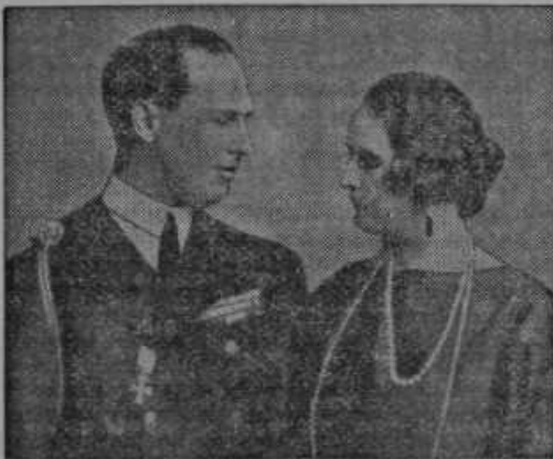
Grška kraljevska dvojica: kralj Jurij in kraljica Elizabeta

raj poldrugo uro. V Bukarešti so čutili glavni potresni sunek tri minute. Mnogo ljudi je bilo v Bukarešti ubitih ter ranjenih in je ostalo brez streh. Ulice prestolnice so razorane ter tako razpokane, da je vsak promet nemogoč. Mnogo hiš bodo morali iz varnostnih ozirov podreti. Kot primer, kako strašen je bil potres, navajamo, da se je 12 nadstropni nebotečnik, v katerem je prebivalo nad 500 ljudi, porušil gladko do tal. Pravijo, da je v tem hotelu stanovalo tudi več nemških in italijan-