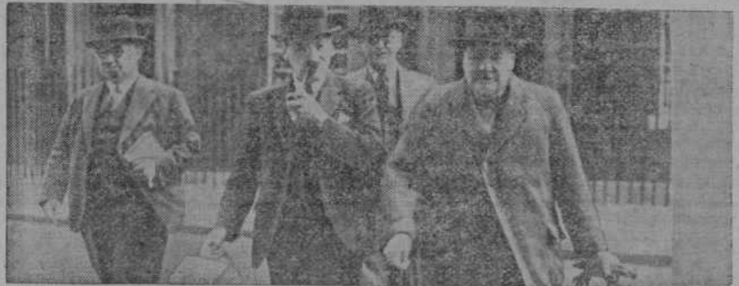
Ministri angleške vlade od leve na desno: delovni minister Bewin, major Attlee, Artur Greenwood in ministrski predsednik Churchill

nad Mariborom, je padla pe stopnicah s podstrešja ter radi hudih posledic dne 28. oktobra umrla. Žalostno so zaznali zvonovi iz cerkve sv. Križa, da nas je zapustila dobra gospodinja, zglede mati sedmih nepreskrbljenih otrok, kateri objokujejo svojo ljubljeno mamo in iščejo tolažbe. Kako je bila rajna priljubljena, je pokazal njen